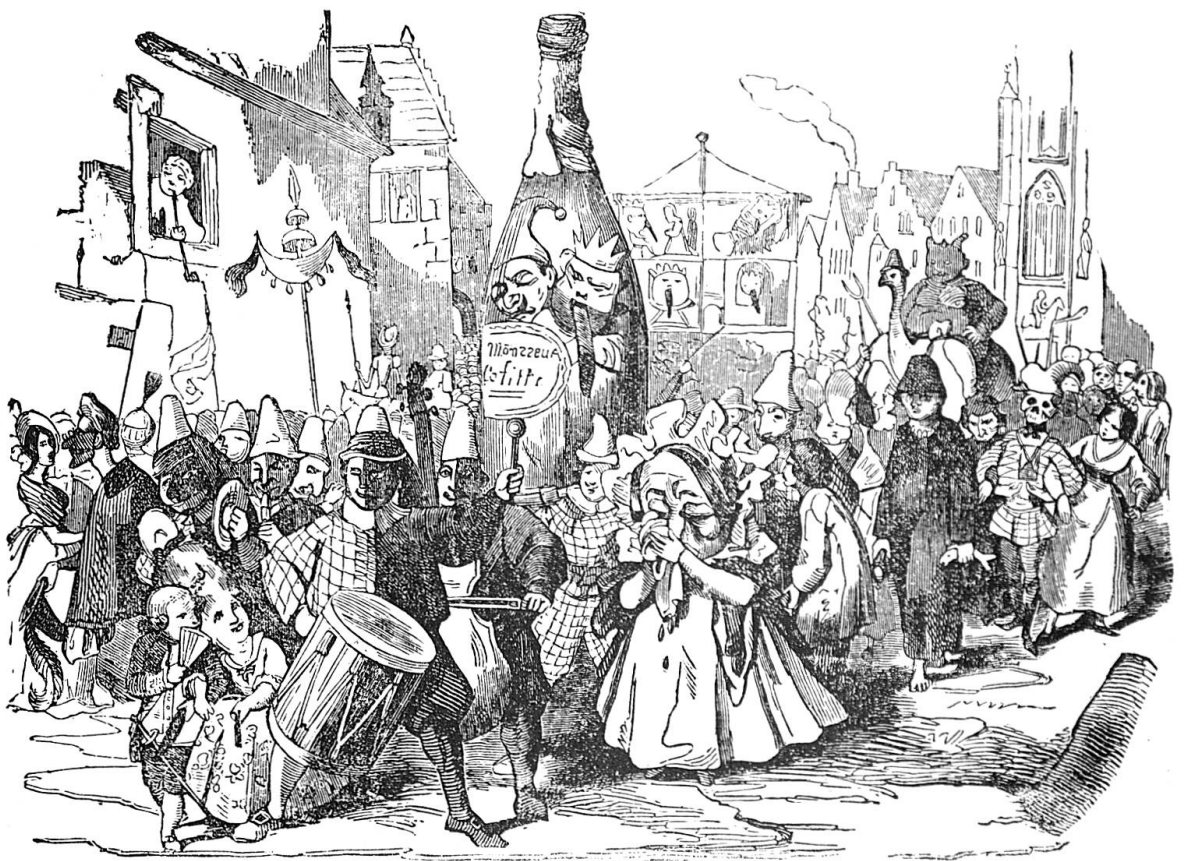
Abb. 8 Beerdigung des Lällenkönigs. Fasnachtssujet um 1840. Illustration im «Zürcher Hinkenden Bott» auf das Jahr 1845.

«Der kalte Nachtwind trieb mir ein Gemisch von Regen und Schnee entgegen. Von allen Seiten erscholl aus der Stadt ein unerhörter Lärm von Trommeln, Pfeifen und jubelnden Menschenstimmen. «Das helle Glöckchen», erläuterte mein Wirth, «ist die Faschingsglocke, sie hat seit zwei Uhr schon eingeläutet.» Jetzt liess sich von der Seite der Eisengasse ein geregelter Marsch aus dem allgemeinen Lärm heraushören. Viele starke Tritte im Sturmschritt nahten sich rasch. Der Thurm wurde an der innern Seite von hellem Fackelschein beleuchtet – das war der erste Faschingszug. Im Ganzen ein unaufhörliches Gewirre von Menschen, die sich, Grosse und Kleine, mit Stücken von Maskenanzügen, oder auch nur mit weissen Hemden und bunten Tüchern phantastisch ausstaffirt hatten. Jeder bis zu den Kindern hatte entweder eine Trommel, eine Pfeife, oder eine Fackel. Den Zug führte ein baumlanger Kerl in der Uniform eines Tambour-Majors der französischen Schweizergarde, hinter ihm kamen sechs Thiermasken mit Blasinstrumenten.