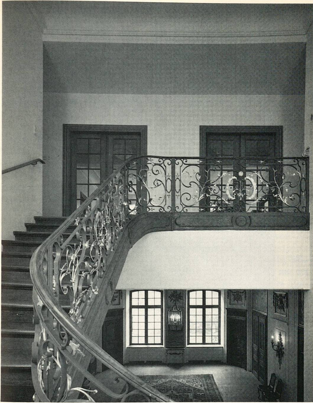
Stadthaus: Treppenaufgang vom 1. zum 2. Stock