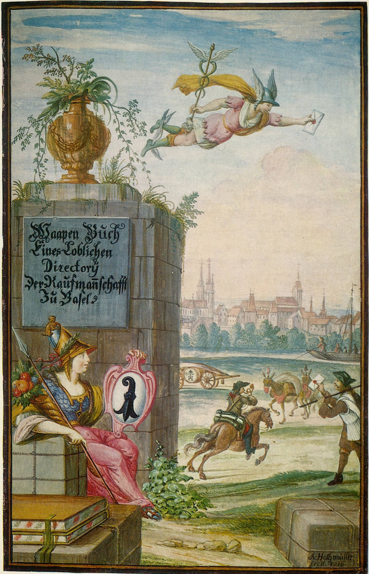
Titelblatt des Wappenbuches des Directoriums der Kaufmannschaft, 1716