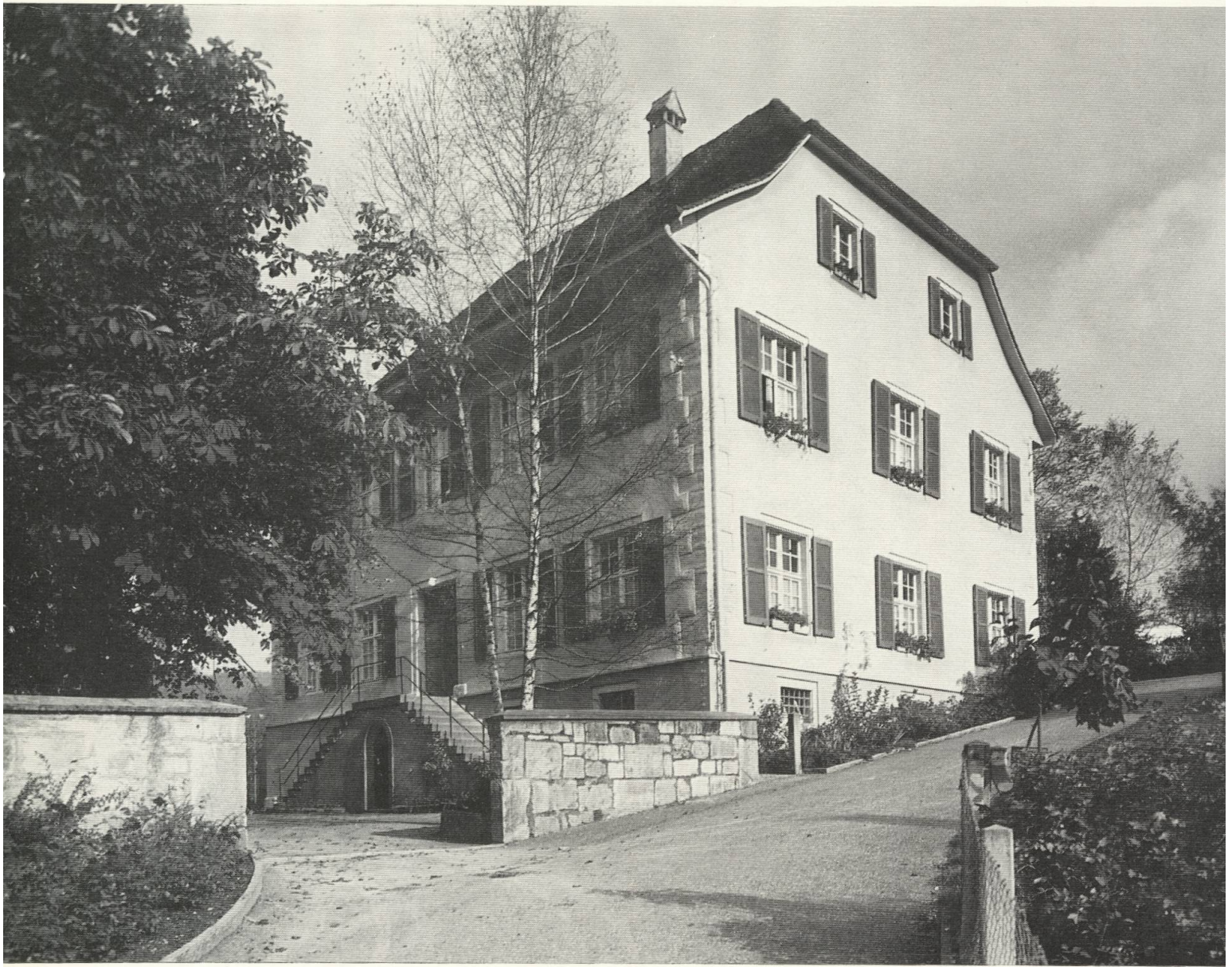
12 Pfarrhaus in Bretzwil