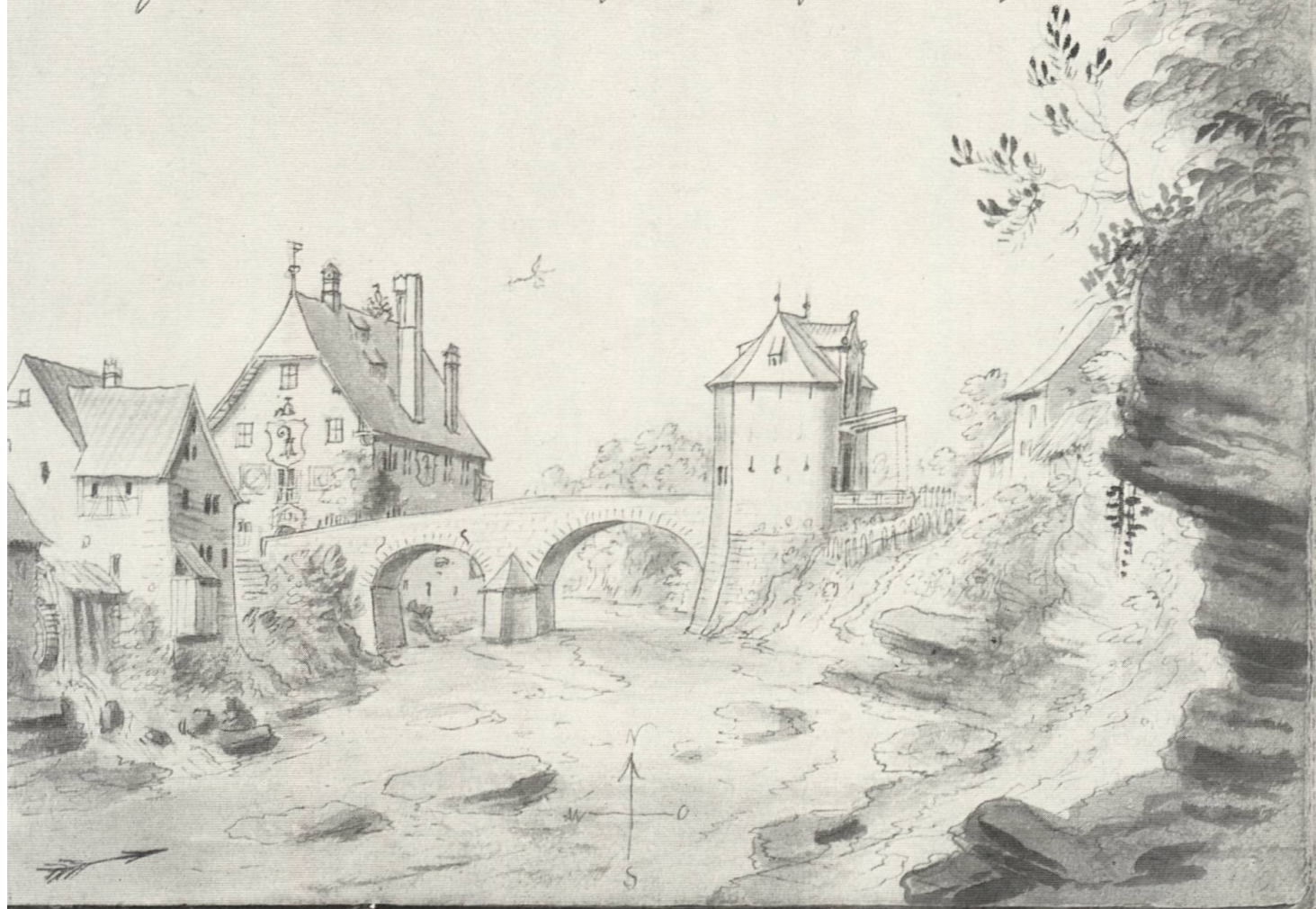
5 Ergolzbrücke in Augst, 1754

Augst an der Limb, von Mittag an gesehen, gezeichnet im Jahr 1754. 21.