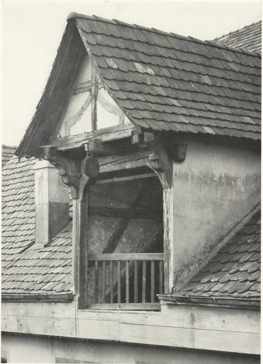
2 Dachaufbau eines gotischen Hintergebäudes in Liestal