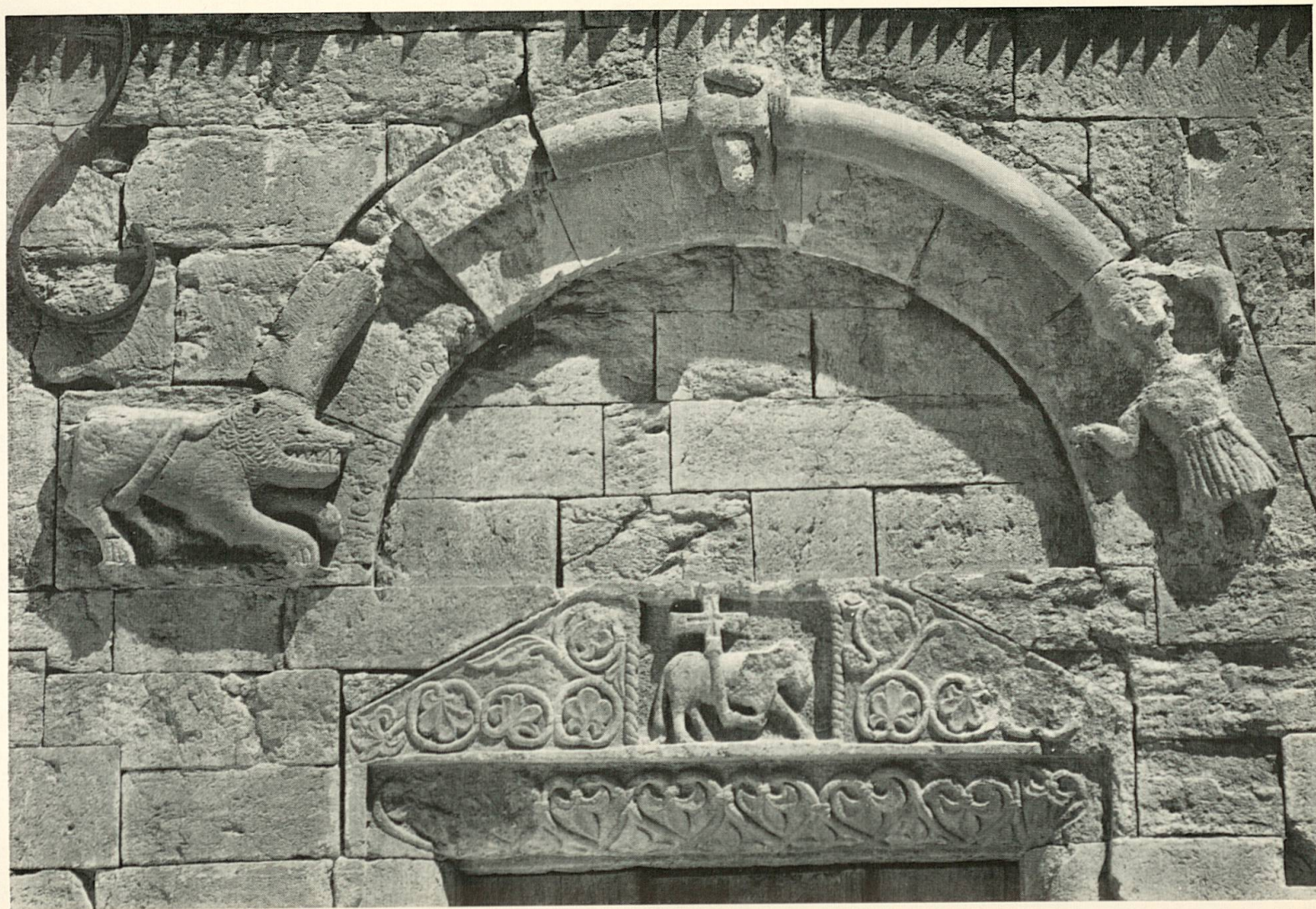
4 West-Fassade des Klosters Schöntal