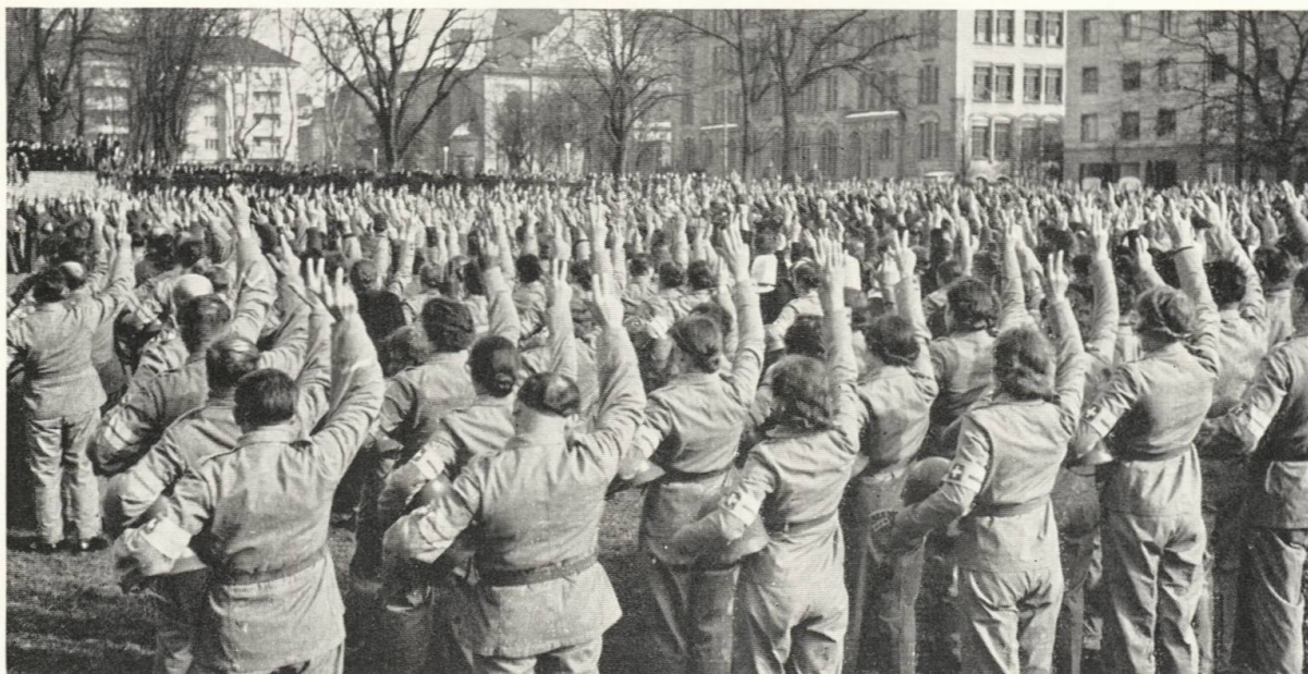
Vereidigung einer Luftschutz-Kompagnie