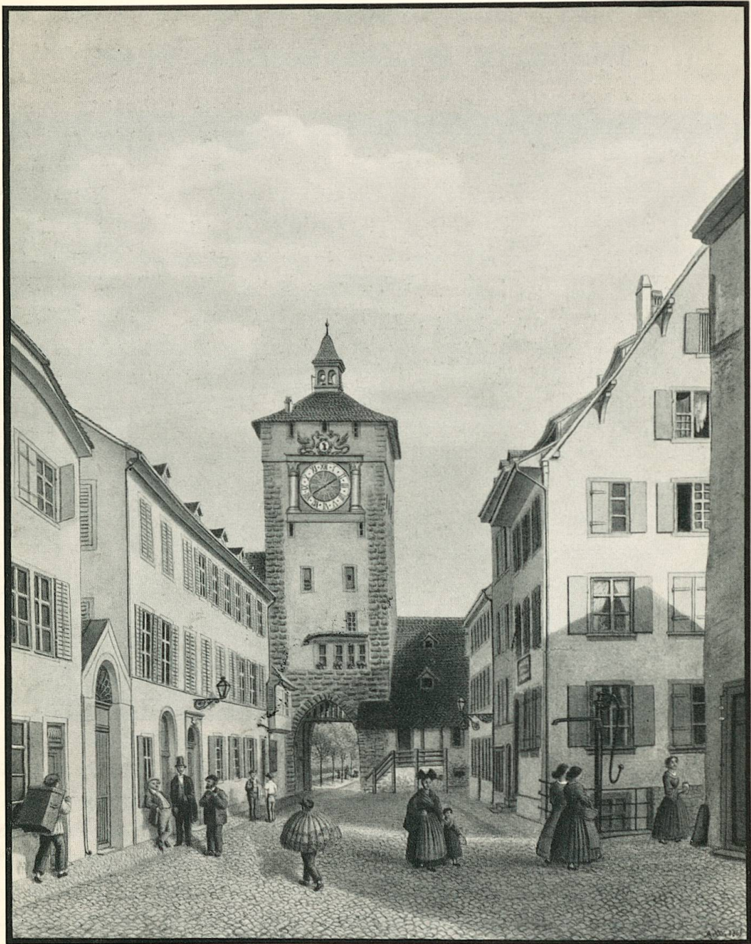
14. Bläsierturm und Untere Rebgasse. Aquarell von Anton Winterlin 1865.