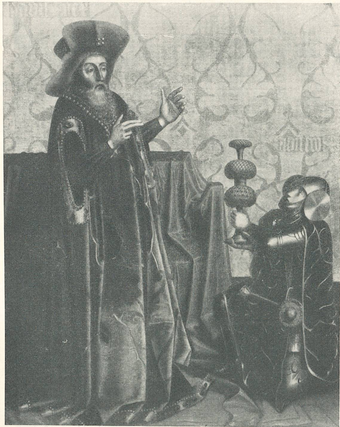
Konrad Witz, König David und die drei Helden.