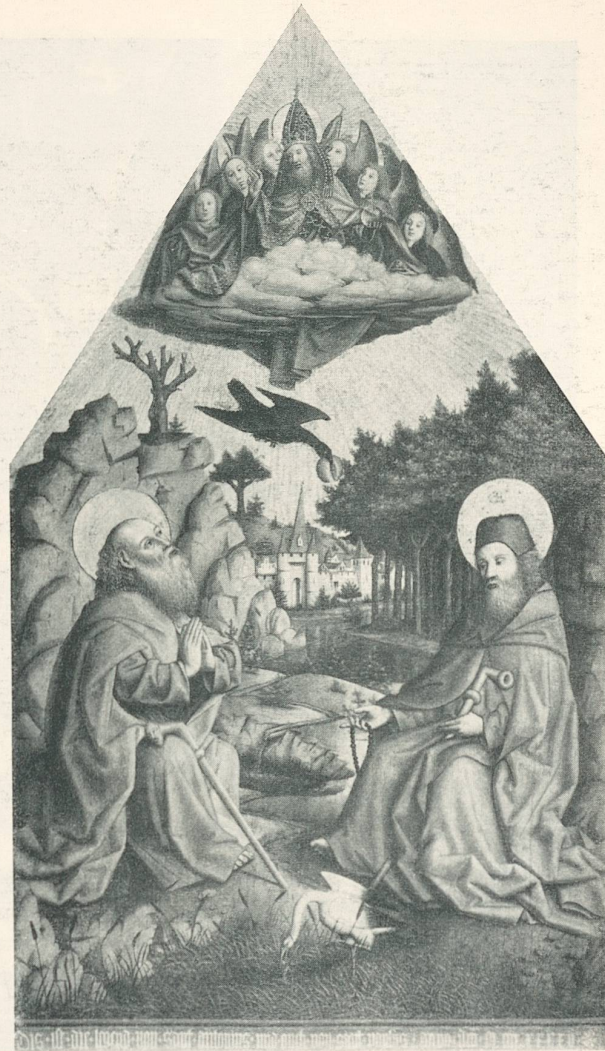
Basler Meister, Die Einsiedler Antonius und Paulus, 1445. Basel, Oeffentliche Kunstsammlung.