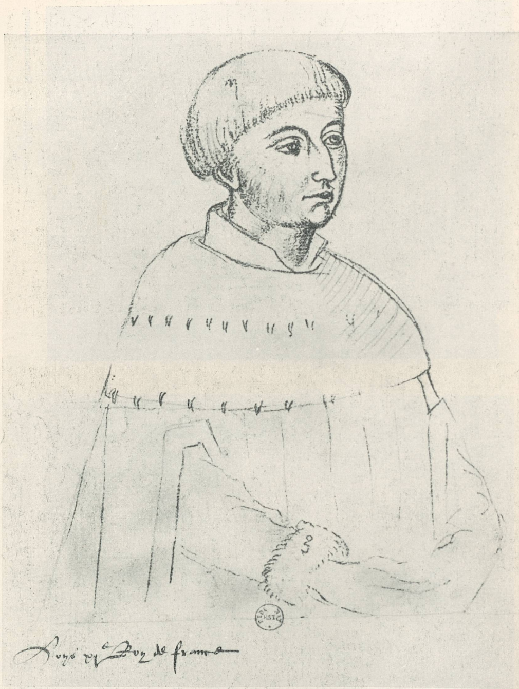
Bildnis des Dauphins, des spätern Königs Ludwig XI. Zeichnung eines niederländischen Künstlers. Paris, Nationalbibliothek.