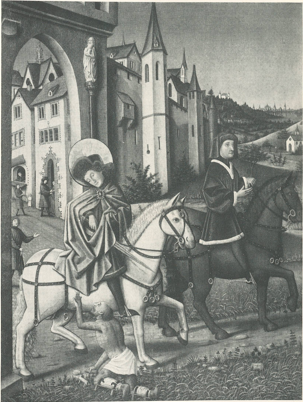
Nachfolger des Konrad Witz, Der hl. Martin.