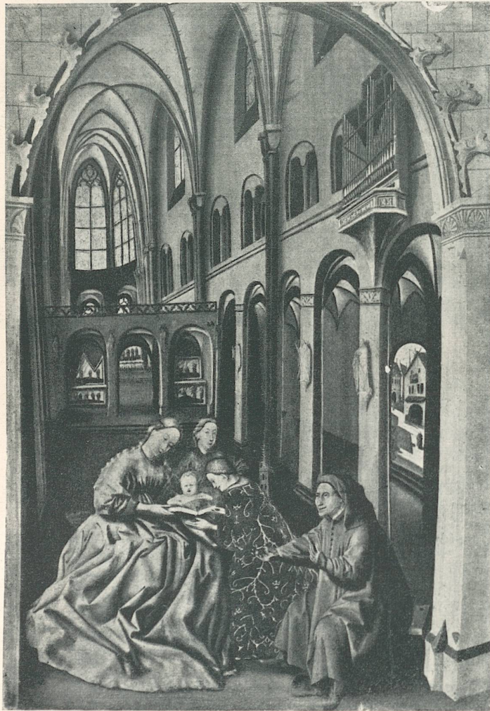
Werkstattgehilfe des Konrad Witz, Die hl. Familie im Basler Münster. Neapel, Museum.