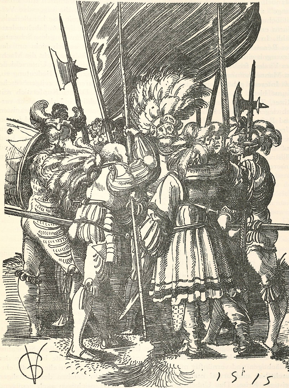
Abb. 4. Urs Graf.