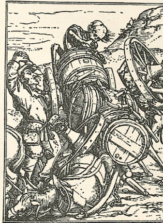
Abb. 6. Hans Holbein. Holzschnitt. Tod und Kärner.

handelt zugleich doch typisch nach seinem Stande, wenigstens nach der Auffassung des Künstlers und der Zeit. Entsetzen packt den Mönch, grimmig höhnend naht der Tod, man verspürt die Spitze und das Vorurteil. Klassische Reife erreicht die Darstellung von Tod und Ackermann (Abb. 5). Die Schilderung vertieft sich zur Rechenschaft über das allgemeine Schicksal. Abendfriede liegt über Acker und Flur. Fast unmerklich hat der Tod die Führung übernommen. Das Sterben verliert seine Bitternis. Alles fügt sich dem unablässigen Walten der Natur.