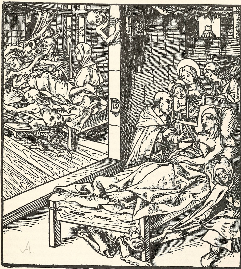
Abb. 3. Meister DS.