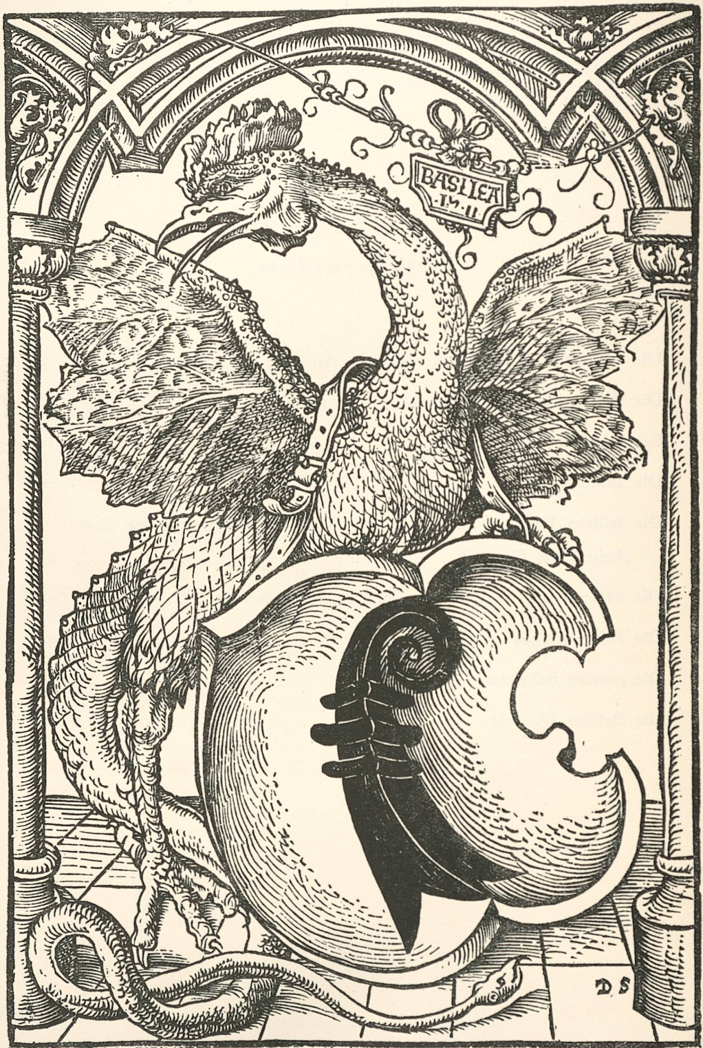
Abb. 1. Meister DS.

Basilisk mit dem Wappen der Stadt Basel.