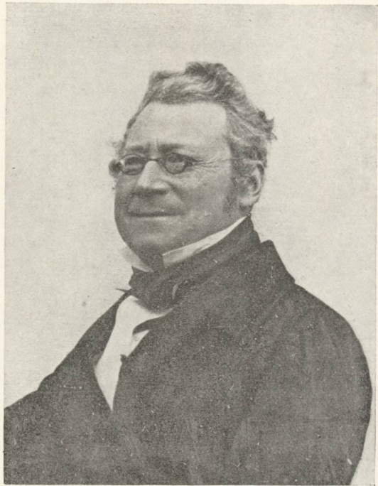
Achilles Bischoff (1795—1867).

Das schweizerische Handels- und Zolldepartement unter Bundesrat Frey-Hérosé von Aarau hatte die Neuordnung der Dinge auf diesem Gebiete vorzubereiten. Es war von höchster Bedeutung, wie sie ausfiel, denn damals schon war vorauszusehen, daß die durch Artikel 23 der Bundesverfassung an die Eidgenossenschaft übergehenden Zölle fortan deren wichtigste Einnahmequelle bilden müßten. Die folgenden, namentlich aber Artikel 26 der Bundesverfassung, gaben die allgemeine Anleitung, nach welchen Grundsätzen die neuen eidgenössischen Zölle zu erheben und die alten kantonalen abzulösen seien. Zur Vorberatung all dieser schwierigen Fragen, die letzten Endes die Bundesversammlung durch Erlaß der entsprechenden Gesetze entscheiden mußte, ernannte der Bundesrat eine Kommission unter Frey-Hérosé; ihr maßgebendstes Mitglied war Achilles Bischoff. Er kämpfte in ihren Sitzungen als überzeugter Anhänger des Freihandels entgegen den Anträgen des Bundesrates für äußerst niedrige Zollsätze. Doch ohne großen Erfolg, indem am 30. Juni 1849 die eidgenössischen Räte nach hartem