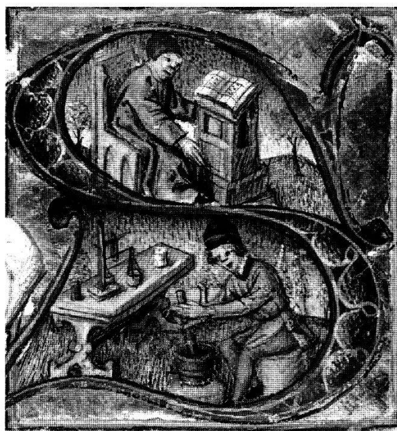
Abb. 3: Der Wurz- oder Salbenkrämer zerstampfte allerlei pflanzliche und tierische Zutaten in Mörsern und stellte geheimnisvolle Mixturen her. Auch im «Convivii Process» spielt der Appothegker eine wichtige Rolle (er liefert den eiteln Frauen Salben zur Verschönerung und stellt ein Tränklein für den kranken Excessus her).

Initiale O (?): urinbeschauernder Arzt. (Zentral- und Hochschulbibliothek, Handschriften und Alte Drucke, KB Msc. 20,4, Blatt 001r).