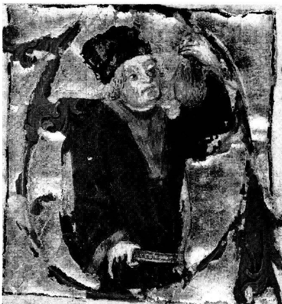
Abb. 2: Seit dem Mittelalter gab es die Trennung zwischen den zwei Berufsgattungen Arzt und Apotheker. Die Diagnose von Krankheiten wurde oft mittels Beschauen, Beschnüffeln und Schmecken des Urins vorgenommen. Das Thema Arztbesuch wurde mit Vorliebe auf komödiantische Weise in Fastnachtspielen abgehandelt - wie im Luzerner Wunderdoktor.

Auch Renward Cysat, der neben seinem Stadtschreiberamt zeitlebens mit seinem ursprünglichen Beruf als Apotheker verbunden blieb und Kontakte zu Medizinern und Arzneikundigen pflegte, lag das gesundheitliche Wohl seiner Mitbürger am Herzen (Abb. 2 und 3). Dies mag wohl einer der Beweggründe gewesen sein, ge-