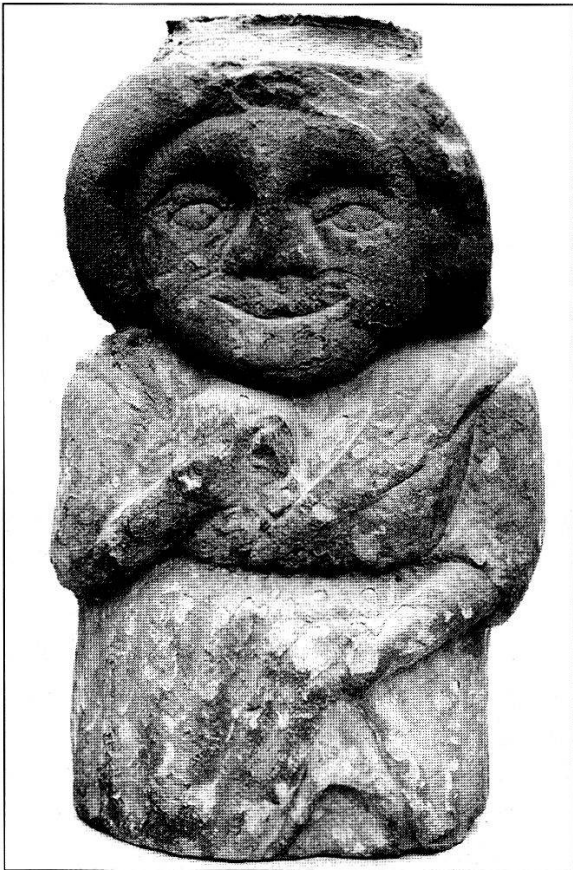
Abb. 7 1580 vermeldete Cysat die Schliessung des öffentlichen Frauenhauses. Damit war allerdings das Kuppelwesen in Luzern nicht aus der Welt geschafft, es gedieh vielmehr heimlich weiter, wie die Szenen mit der Zamendeckerin im «Convivii Process» verraten. Sandsteinfigur eines Luzerner Frauenhauses (16. Jh.). Das Hochhalten des Rockes mit der linken Hand ist deutlich erkennbar.

halten und keinerlei brauchwürdige Zusammenkünfte zu dulden. Cysat ruft in seinem Schauspiel auf zu rigoroser Sittenstrenge, Sozialkontrolle und Disziplinierung.