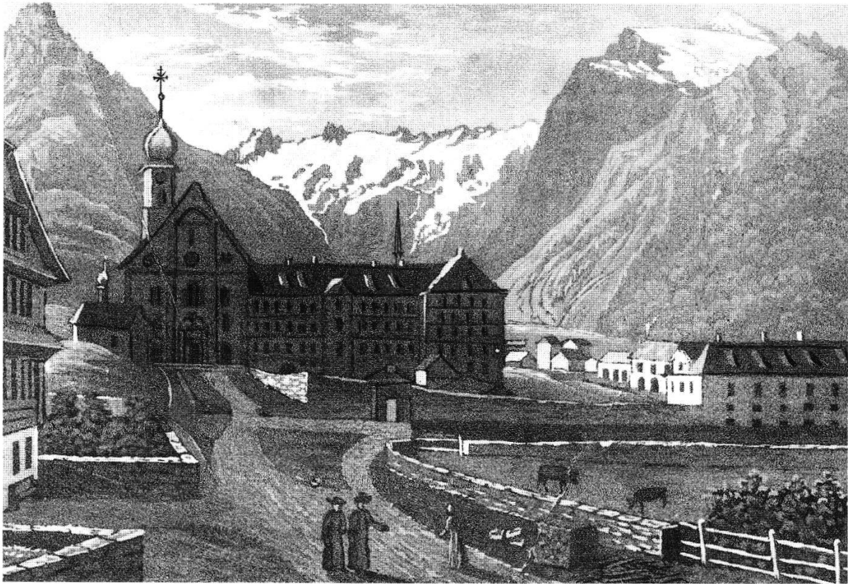
Abb. 1: Das Kloster Engelberg von Westen. Rechts das Ökonomiegebäude. Im Hintergrund links der Hahnen, in der Mitte das grosse und kleine Spannort, rechts der Titlis. Aquatinta um 1850.

Feindbild nicht mehr; drittens erinnern die entehrenden Körperstrafen an altertümlichen Strafvollzug.