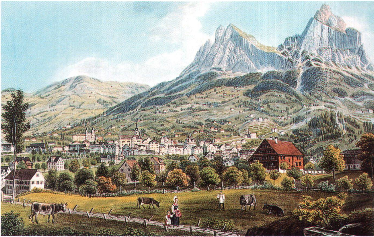
Abb. 3: Schwyz. Ansicht von Süden. Links über dem Flecken Schwyz thront das 1844 von den Jesuiten erbaute Kollegium (Kirche und Westflügel, der Ostflügel wurde erst 1858/59 erbaut). In der Bildmitte am Fuss des kleinen Mythen befindet sich die Haggenegg. Aquarell von David Alois Schmid (1791–1861).

formung des Kantonsnamens «Schwyz». Dieser Name 54 in seiner mittellateinischen Form Suetia sei übrigens fast identisch mit jenem von Schweden, ein Beweisstück mehr für jene vielen Schwyzer und Schweizer (besonders auch im Oberhasli), die an ihre Abstammung von eingewanderten Schweden glaubten. Für den Ethnographen ist die seltsam tiefe Verwurzelung dieser Herkunftssage im Volksbewusstsein interessant, mehr als ein für ihn unwahrscheinlicher historischer Kern. (I, S. 341, 150–153)