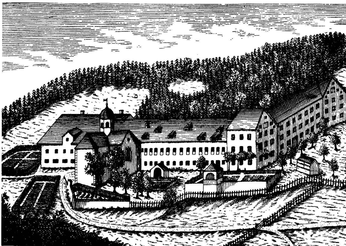
Abb. 4: Trachslau bei Einsiedeln, Benediktinerinnenkloster in der Au. Kupferstich von Stephan Oechslin um 1828.

Es sind denn auch die internationalen Pilgerströme, die Kohl noch mehr faszinieren als der prächtige Innenraum der Kirche mit der schwarzen Madonna. Nur Loretto in Italien und Santiago in Spanien hätten «von allen Wallfahrtsorten der eu-