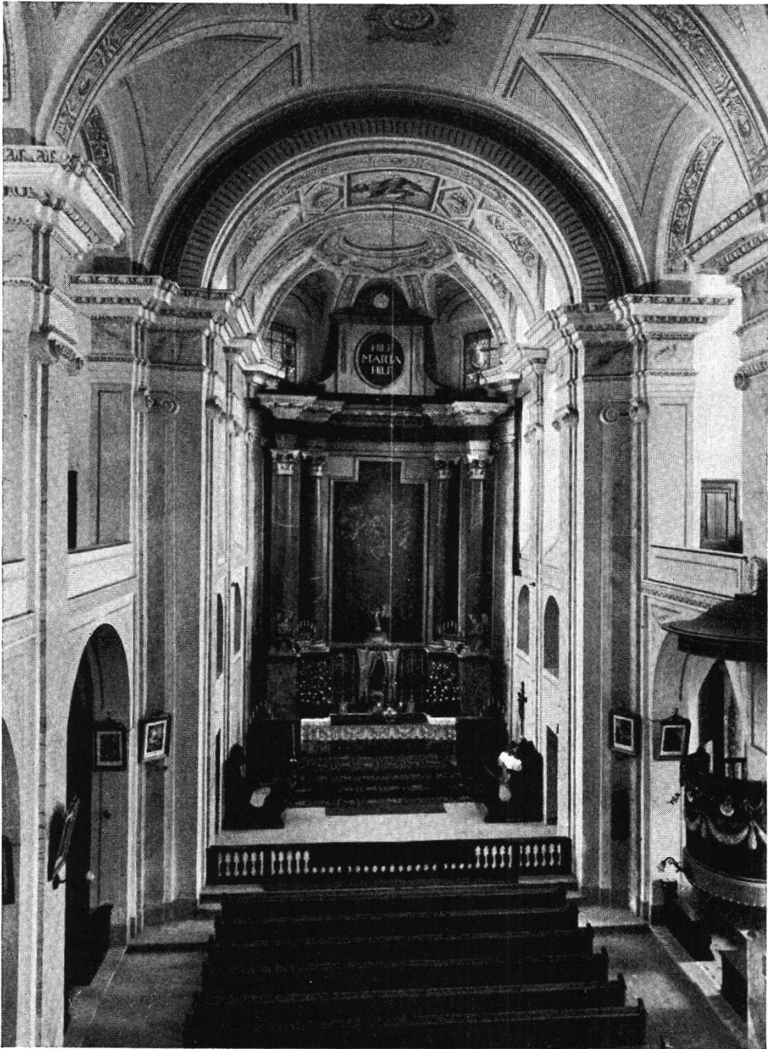
INNERES DER MARIAHILF-KIRCHE Original-Aufnahme 1933