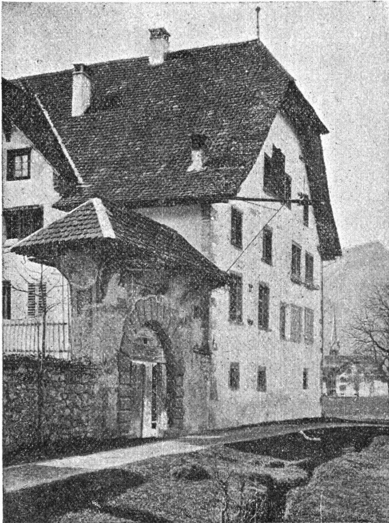
Das Winkelriedhaus. Ansicht von Norden.

Hierusalem“ hebt er mit Vergnügen hervor, wie er 1583 auf dem Heimweg von Palästina im Jesuitenkolleg zu Neapel den berühmten spanischen Theologen Alphons Salmeron wiedergefunden. Das 1564 gedruckte Exemplar der tridentinischen Beschlüsse, von der Konzilskanzlei durchkorrigiert und handschriftlich beglaubigt, hielt er als teures Andenken zeitlebens