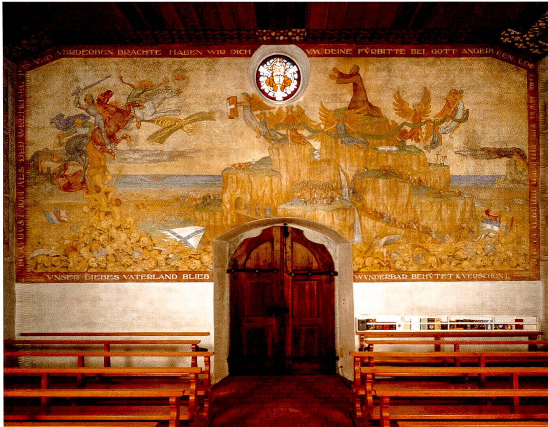
Votivbild für Bruder Klaus von Flüe in der Unteren Ranftkapelle von Sachseln. Der Ursprung dieses Votivbildes geht auf die Initiative des Schweizerischen Katholischen Volksvereins zurück, welcher 1914 um die Fürbitte von Bruder Klaus um Verschonung der Schweiz im Weltkrieg anrief und das Gelübde tat, bei Erfüllung dieser Fürbitte, eine Weibegabe zu stiften. Zu Beginn der 1920er Jahre wurde dieses Gelübde eingelöst

auch Gasmasken usw. sich erkennen lassen. Auf den Leichenhaufen liegende Königskronen symbolisieren die während und am Ende des Weltkriegs untergegangenen Monarchien. Bei genauerem Hinsehen interessant ist insbesondere die durch den Berg stilisierte Schweiz: Obwohl es Motive der Idylle wie die sorglos um einen Apfelbaum tanzenden Kinder gibt, überwiegen kritisch-satirische Elemente wie die karikierende Darstellung der obersten schweizerischen Heeresleitung. Daneben finden sich Motive für die während der Kriegszeit vorgegangenen wirtschaftlichen Spekulationen, dargestellt in der Figur von Käsehändlern, welche ihre Käselaike in Sicherheit bringen und damit die Kriegsgewinnler symbolisieren. Oder die Zeichnung eines Flüchtlingsstromes, welche von einem dienstfertigen Oberkellner mit Serviette über dem Arm empfangen werden, «eine Andeutung an eine nicht nur selbstlose Flüchtlingspolitik.» 11