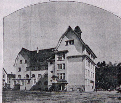
Westliche Ansicht vom Spielplatz aus.