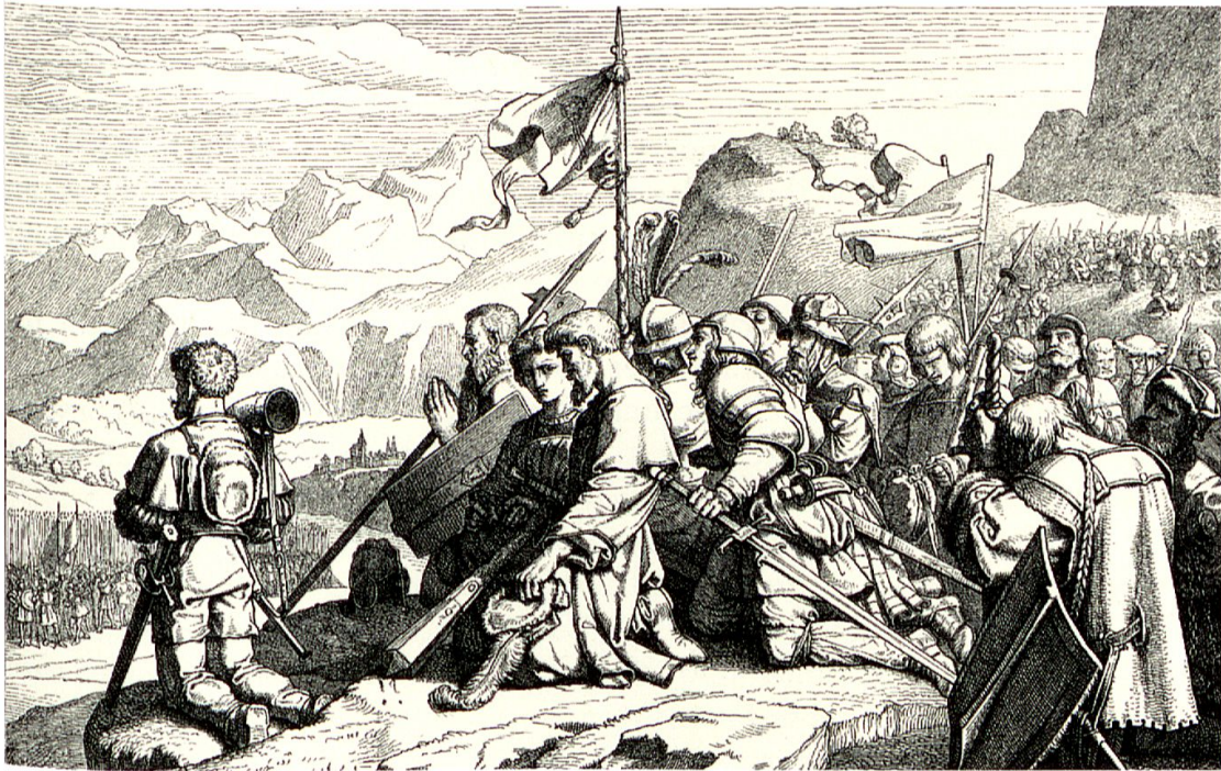
1834 fertigte der deutsche Historienmaler Alfred Rethel eine Zeichnung, welche die Eidgenossen beim Gebet vor der Schlacht zeigt. Nicht frei von spätromantischer Verklärung veranschaulicht das Bild gut die zeitgenössische Vorstellung von der besonderen Tugendhaftigkeit der Alten Eidgenossen, SAS RMS 1507.