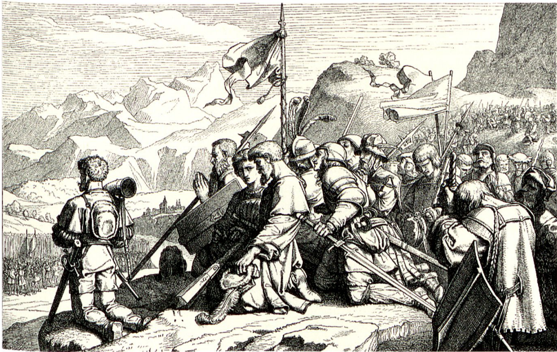
1834 fertigte der deutsche Historienmaler Alfred Rethel eine Zeichnung, welche die Eidgenossen beim Gebet vor der Schlacht zeigt. Nicht frei von spätromantischer Verklärung veranschaulicht das Bild gut die zeitgenössische Vorstellung von der besonderen Tugendhaftigkeit der Alten Eidgenossen