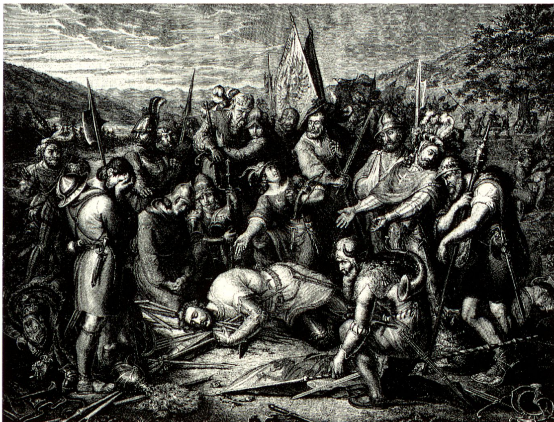
Die 1841 gemalten «Eidgenossen bei der Leiche Winkelrieds» von Ludwig Vogel gehören wohl zu den bekanntesten Winkelrieddarstellungen. Das Ölgemälde wurde in der Folge öfters reproduziert, so auch für den vorliegenden Druck, der 1886 angefertigt wurde, SAS RMS 0990.

Neffe Leopolds III., Herzog Friedrich IV., eine singuläre Jahrzeitstiftung zu einer kollektiven Gedenkfeier erweiterte und dadurch ebenso das Gedenken an die Schlacht wie die Erinnerung an die eigentlich rechtmässige Herrschaft Habsburgs wach hielt. Erst nach der Niederlage bei Arbedo 1422 zog Luzern nach, verordnete erstmals einen kollektiven Gedenktag für Schlachtgefallene, um 1501 im Nachgang an den für die eidgenössische Identitätsbildung wichtigen Schwabenkrieg eine umfassende Schlachtjahrzeitverordnung vorzulegen. 5