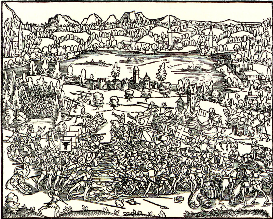
Das Bild in der gedruckten Chronik von Johannes Stumpf aus dem Jahr 1548 hat die Vorstellungen von der Schlacht bei Sempach entscheidend geprägt. Eine ähnliche Darstellung wurde im 16. Jahrhundert an der Seitenwand der Schlachtkapelle angebracht (STUMPF, Chronick, Bl. 240v).

zu machen und die schlacht zu malen, auch anders mer mit stülen und was darin manglet».45 Wie aus den Abrechnungen der Seevogtei vom folgenden Jahr hervorgeht, wurden für die Arbeiten der Schreiner, Steinmetze und Maler insgesamt 13 Gulden ausgegeben, zusätzlich bezahlte der Rat gemäss den Aufzeichnungen des Stadtschreibers Renward Cysat weitere 100 Gulden.46 Erst im Rahmen dieser umfassenden Renovation scheint also das Schlachtgemälde an der nordwestlichen Seitenwand entstanden zu sein. Die Abbildung stützt sich auf die bekann-