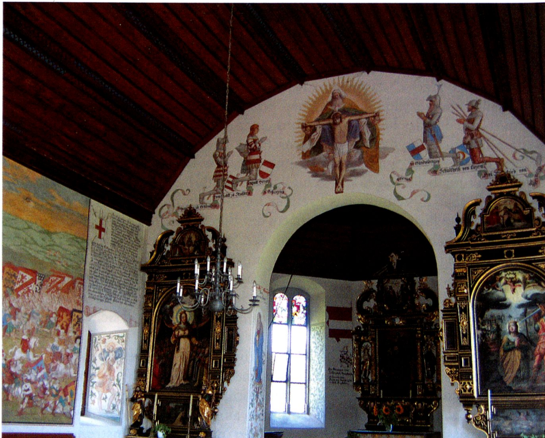
Die Kapelle auf dem Schlachtfeld oberhalb von Sempach ist im Lauf der Jahrhunderte immer wieder drastisch umgestaltet worden. Die heutige Ausgestaltung entstand für die Jubiläumsfeier 1886, greift aber ältere Darstellungen auf.

wie sich seine Inhalte, Formen und Funktionen im Lauf der Zeit veränderten und wie dadurch die Erinnerung an das Ereignis geprägt und umgestaltet wurde. Die Erfindung von Traditionen, die gemeinhin als typisch modernes Phänomen der Nationen- und Nationalstaatenbildung im 19. und 20. Jahrhundert beschrieben wird, lässt sich somit am Beispiel des Sempacher Schlachtgedenkens bis ins Mittelalter zurückverfolgen. 6