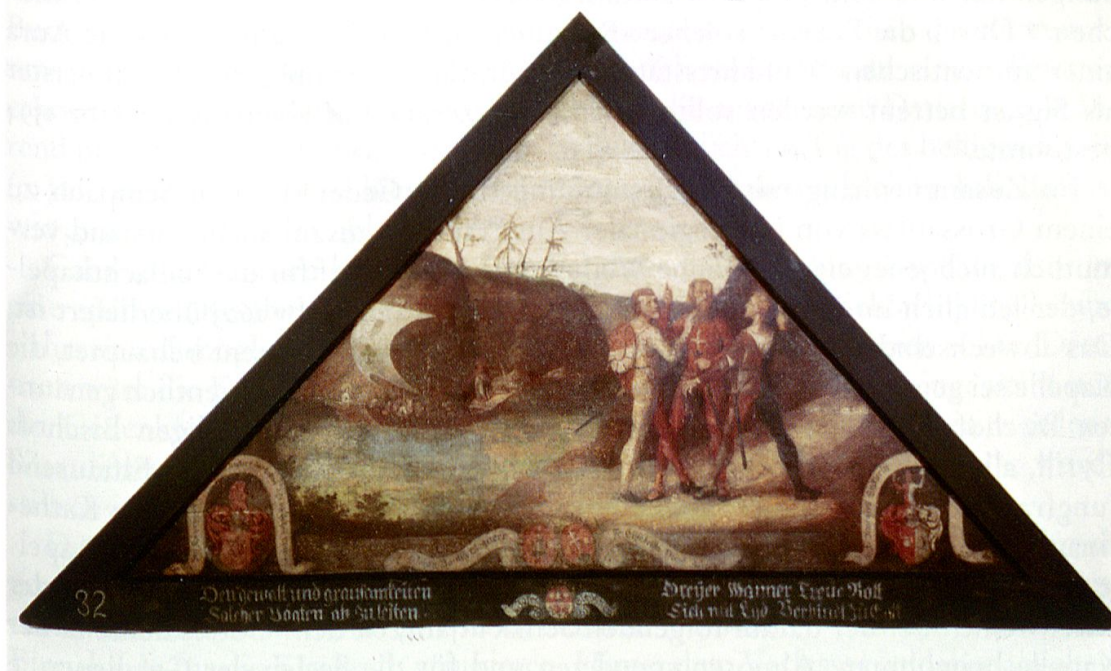
An der Wende zum 17. Jahrhundert wurde die Luzerner Kapellbrücke mit Abbildungen zur eidgenössischen Geschichte geschmückt. Eine ähnliche Darstellung des Rütli Schwurs war damals auch in der Schlachtkapelle zu sehen (Stadtarchiv Luzern F2a_Brücken_24_12_32).

tesdienst hatte am Morgen zwischen der sechsten und siebten Stunde zu beginnen. Zelebriert wurden drei Ämter, nämlich eines für die Verstorbenen, das zweite zu Ehren der Dreifaltigkeit und das dritte im Namen der Jungfrau Maria. Gleichzeitig sollte der Priester aus dem benachbarten Eich eine Messe in Kirchbühl halten und das dortige Beinhaus visitieren, weil man davon ausging, dass einige der Gefallenen dort begraben worden waren. 67