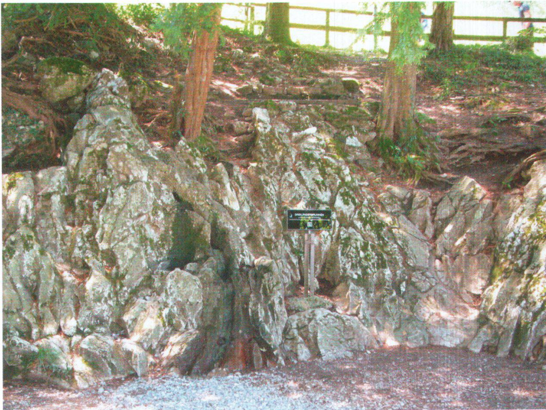
Der Dreiländerbrunnen auf dem Rütli im heutigen Zustand.