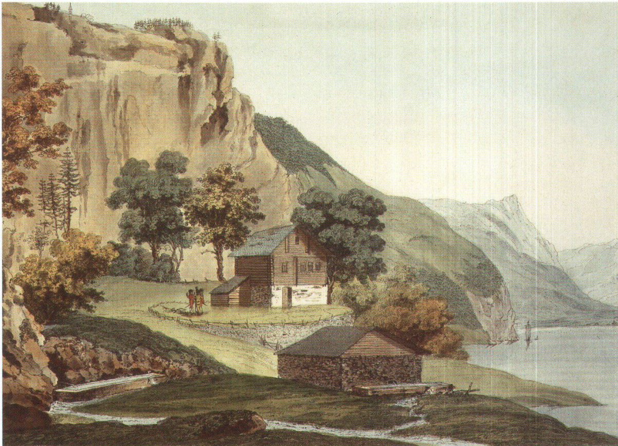
Abb. 1: Die Rütli-Quelle mündete anfänglich, wie diese im Geiste des späten 18. Jahrhundert gestaltete Idylle zeigt, in einen ganz gewöhnlichen Wassertrog.