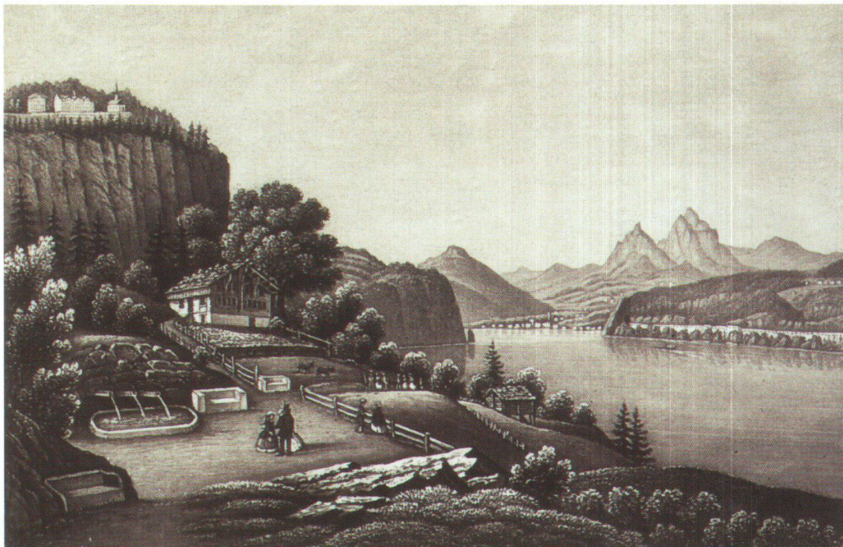
Abb. 2: In einer nächsten Phase wurden die Quellen offenbar so gestaltet, dass drei Fassungen die drei beteiligten Orte repräsentierten (Staatsarchiv Uri).