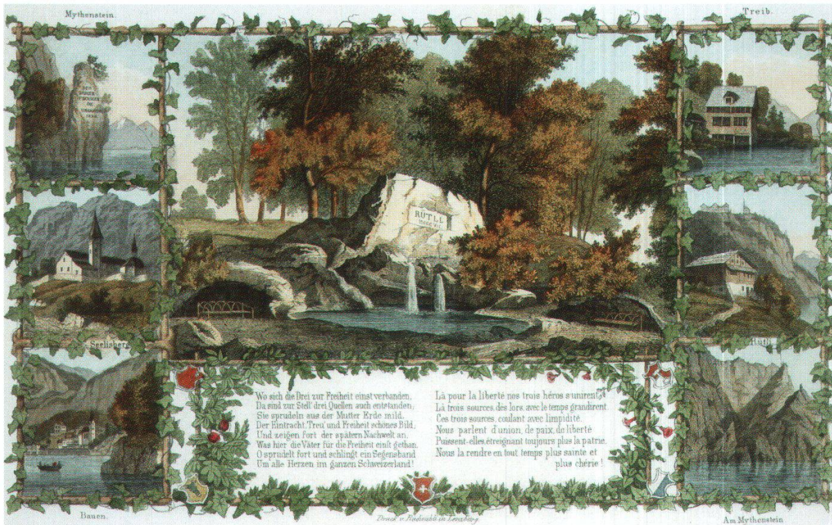
Abb. 3: Erst Monumentalisierung des Rütli, sowohl in der Realität als auch in damaligen Printmedien, unverständlicherweise bloss zwei Quellen zeigend (Staatsarchiv Uri).