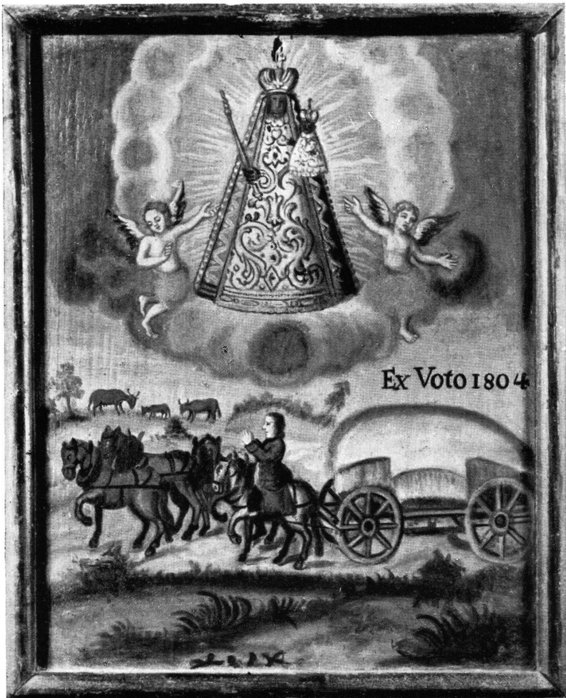
Ex voto eines Kaufmanns 1804