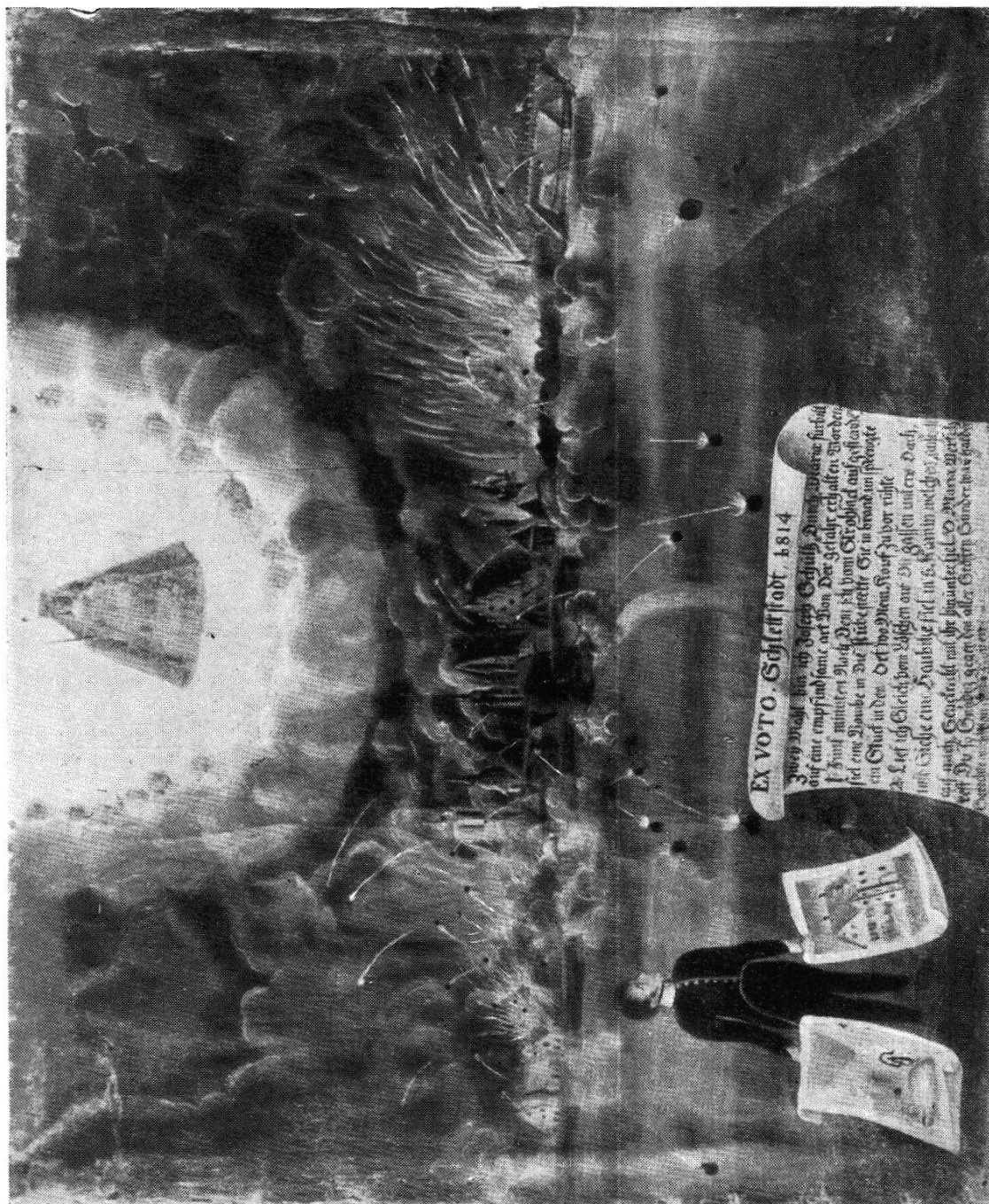
Belagerung von Schlettstadt 1814