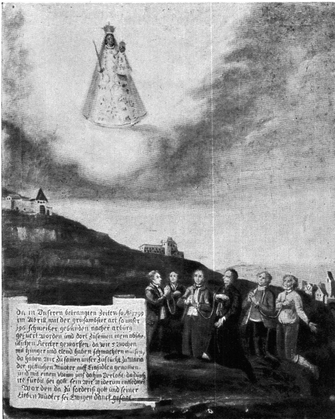
Die nach Aarburg geschleppten 196 Schweizer danken für ihre Rettung 1799