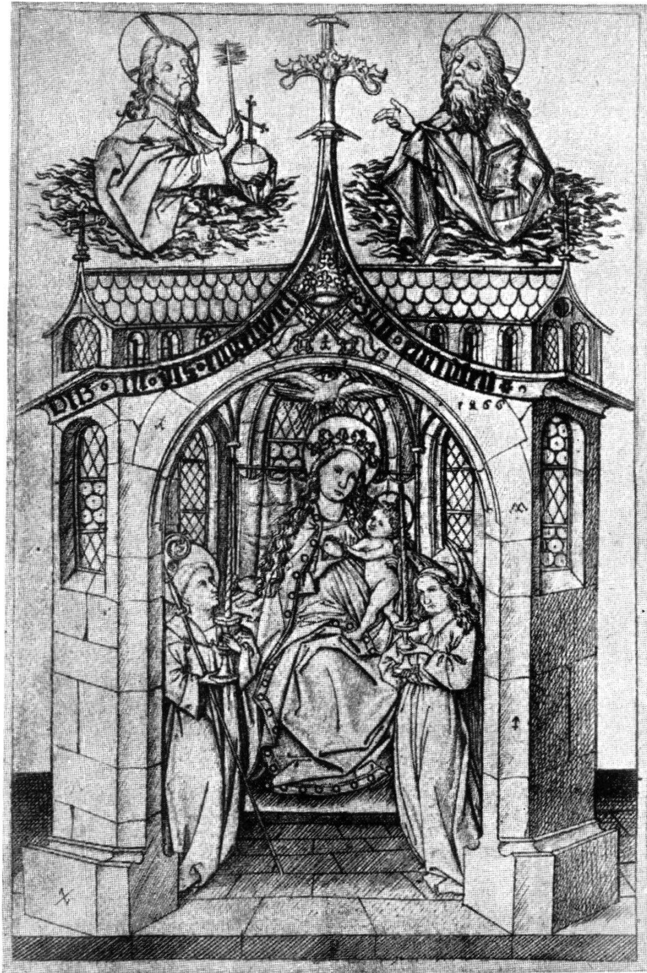
Die kleinere Madonna des Meisters E. S. (Stich von 1466)