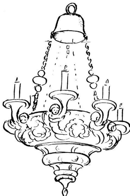
Große Ampel aus St. Urban

Nicht übergehen wollte ich die große Ampel aus St. Urban, welche Pius IX. der Basilika von St. Petronio in Bologna gestiftet hatte. Sie hängt in der zweiten Kapelle links vom Hauptportal und das Silber hat vor lauter Patina beinahe Bronze-Farbe. Der vergoldete Kupferkessel ist reich mit Silber verziert und das aus den Beschreibungen bekannte Charakteristikum fehlt nicht, der Kranz von sechs Engeln als Lichtträger, welche die