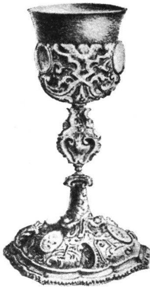
19 Silbervergoldeter Barockkelch mit Email