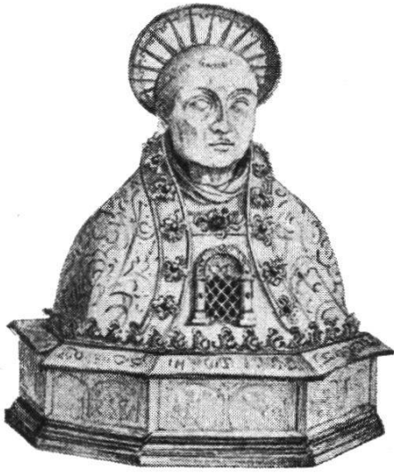
21 Silberbüste St. Bernhard von Urs Graf Vier Platten vom Postament im Schweiz. Landesmuseum

Verschollene Werke nach den Lithographien im Pariser Auktionskatalog von 1851