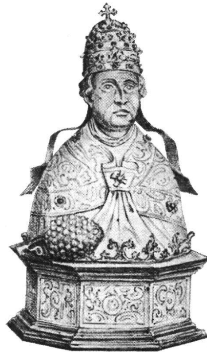
22 Silberbüste St. Urban