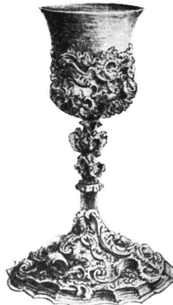
20 Silbervergoldeter Rokokokelch