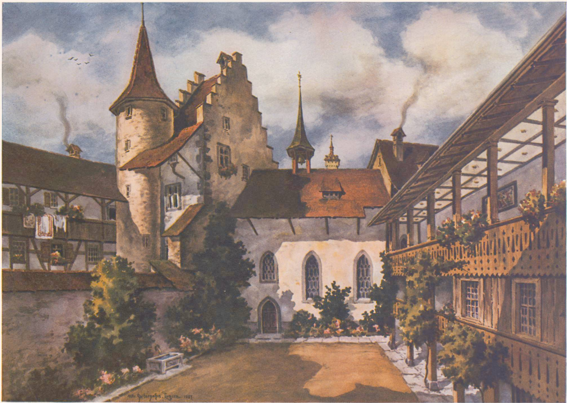
KAPELLE AM LÖWENGRABEN (Dritte Niederlassung der Ursulinen)