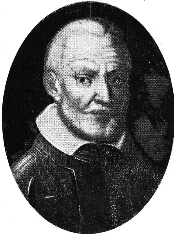
60. Beat Zurlauben I. (nach einem Oelportrait)