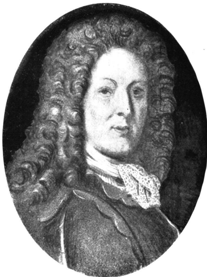
104. Fidel Zurlauben (nach einem Oelportrait)