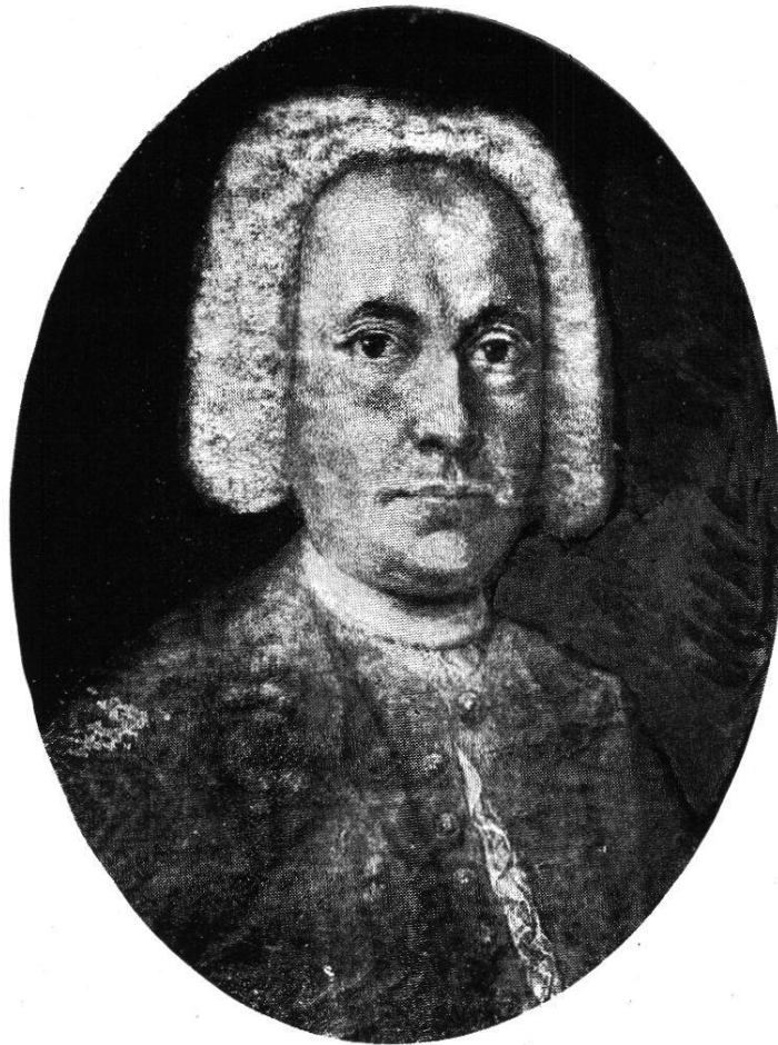
101. Klemens Damian Weber (nach einem Oelportrait)