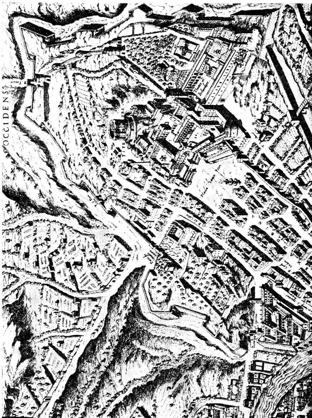
Der Vatikan und Teile der Leostadt aus der Vogelperspektive (nach dem Prospect von Du Pérac-Lafréry) (aus dem Jahre 1577)