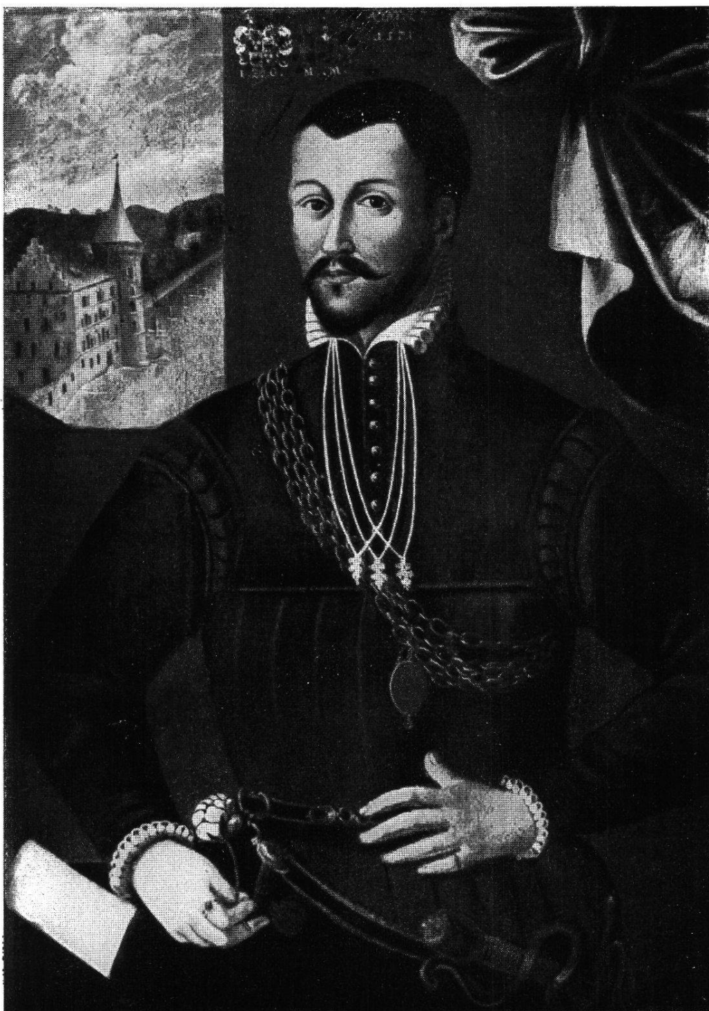
Ludwig zur Gilgen „flos latinitatis“ 1547—1577