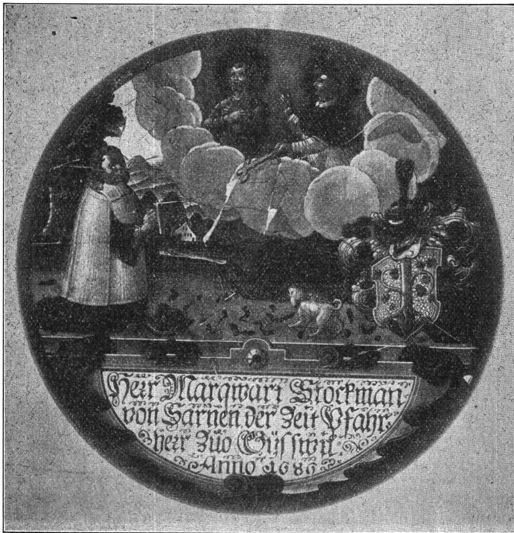
Gebrochenes Figurenscheibchen in Privatbesitz zu Kerns.

göttlicher Gnaden durch ordenliche Wal zu Bäpstlicher Administration kommen und von derselben nächsten Blutsverwandten, jetz sin Fürstlich Gnaden, vernomen, das Ir Gnad zu geistlichem Stand begirig, da habe Ir Heyligkeit alle gnädigiste Befürderung dartzu gethan.“ Unter den nämlichen Tagherren