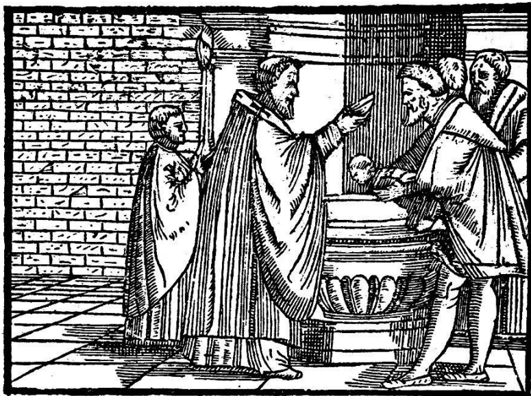
Taufbild aus dem Sacerdotale Romanum von 1567.

oder Taufbrunnen herausheben und der Hebamme zur Bekleidung übergeben. Der Priester, der die Taufe vollzieht, ist der Pater spiritualis , der Pate aber, entsprechend seiner Funktion, nur der Compater . Sehr anschaulich ist der Vorgang illustriert im Rituale des oberösterreichischen Benediktinerstiftes Lambach aus dem XII. Jahrhundert. 1) Nicht weniger klar spricht das Sacramentale des hl. Karl Borromeo, in dessen Bistum die Taufe noch heute durch Untertauchen gespendet wird. Nach dem Taufakt besagt eine Rubrik: „ Compater autem postremo manum infanti supponat et de fonte levat atque ita tenet, ut orientem spectet. “ 2) Obwohl diese alte Taufweise