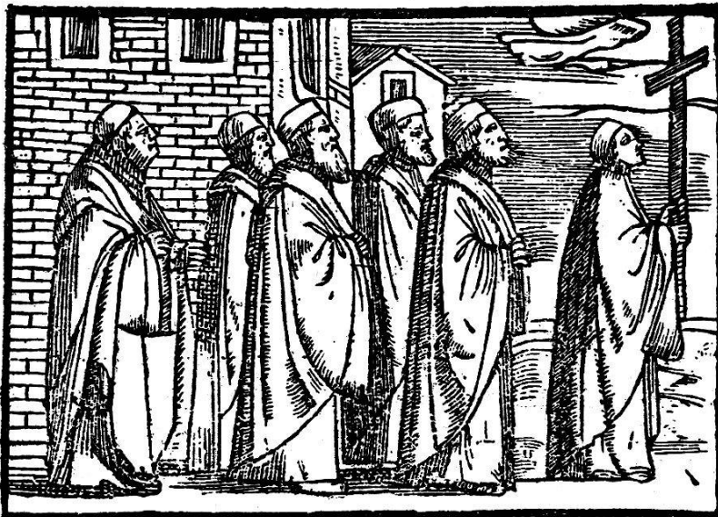
Prozessionsbild aus dem Sacerdotale Romanum von 1567.

Am Ostermittwoch veranstaltet das Stift Engelberg einen Bittgang durch die Hallen der Kirche und zwar ohne Kreuz und Fahne, unter bloßer Vorantragung der Osterkerze. Schon der Annalist Straumeyer (†1743) berichtet darüber, es wisse niemand anzugeben, weshalb die Prozession abgehalten werde, er könne nur sagen: „Patres nostri annuntiaverunt nobis.“ 1) Nachdem wir die Grundlage, auf welcher sich die Sitte der Osterprozessionen aufbaute, im Vorstehenden schon bloßgelegt, ist es nicht mehr schwer auch den Bittgang des Stiftes Engelberg richtig zu deuten. Als man den täglichen Besuch des Taufbrunnens bereits aufgegeben hatte, blieb doch die erste und