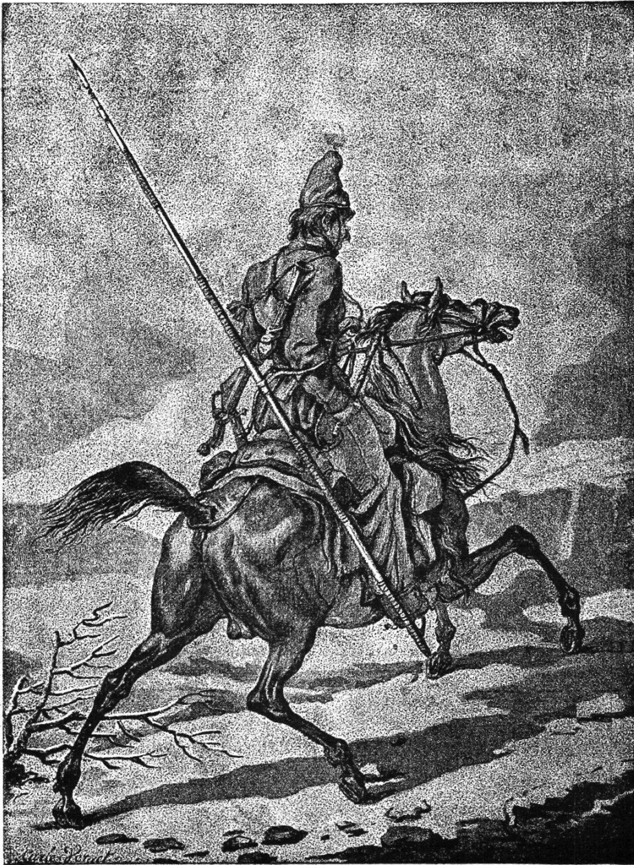
Kosak in der Ausrüstung von 1799.

das Bisi-Tal und den Ruosalp-Kulm-Pass vorzudringen und zu verhindern, dass nicht über diesen Pass vom Linttal und vom Schächen-Tal her die Russen und Östreicher in das Muota-Tal einfallen und von hier aus über den Pragerl