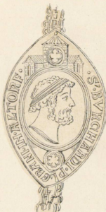
1274, 17 Augstm.