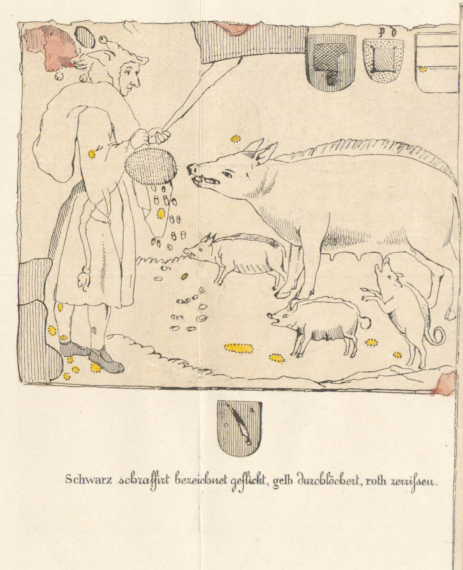
Schwarz schwarzfirt bezeichnet gefleckt, gelb durchbleibet, roth zerissen.