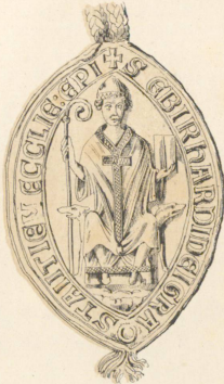
1251, 14 März.