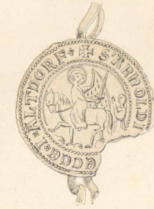
1352, 28 Heum.