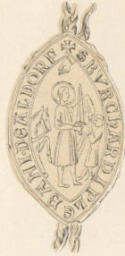
1282, 10 Christm.