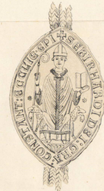
1257, 2 Brachm.