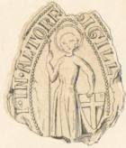
1514, 25 Winterm.