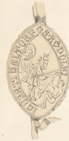
1284, 9 Brachm.