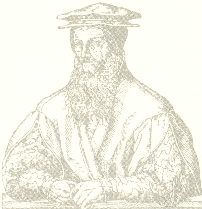
Conrad Gessner 1516–1565

Swiss Journal of the History of Medicine and Sciences Vol. 59 (2002) N° 3/4