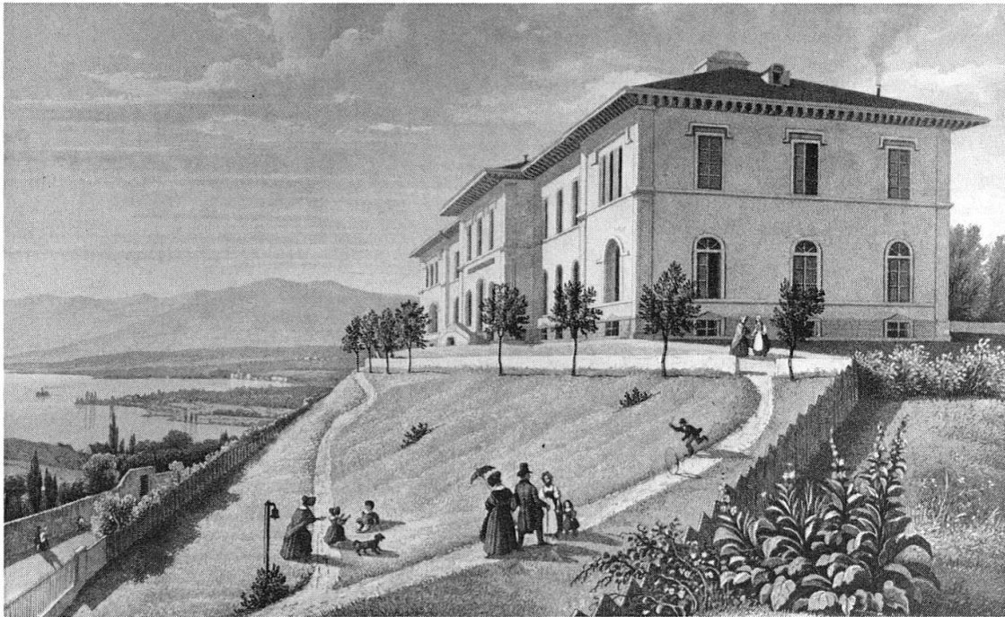
L'Asile des aveugles de Lausanne (1843), vers 1845 (Gravure de Frédéric Martens, Musée historique de Lausanne).

cantonal dès 1806, assuré d'une dotation considérable grâce à la suppression de l'Hôpital de Villeneuve, l'établissement entame sa lente mue de «miséricorde» en hôpital moderne, avec le départ successif des aliénés (1811) 10 , des détenus (1826) et des établissements de redressement pour garçons (1847) et filles (1869) 11 . La transformation de l'asile en centre de soins s'étend donc sur quatre-vingts ans, du rapport Tissot à l'ultime épuration. Mue trouvant son expression décisive dans le dernier quart du siècle, avec deux premières réalisations publiques d'envergure: l'Asile d'aliénés de Cery (1873) 12 et l'Hôpital cantonal du Calvaire (1883). L'Etat de Vaud, jusque-là trop absorbé par les charges multiples de l'indépendance et les soubresauts politiques de 1830, 1845, 1861, est enfin en mesure d'assumer son rôle en matière d'établissements pour malades. De plus, l'hôpital général, après six siècles au cœur de la cité, domine désormais symboliquement la ville, du haut de la pente du Champ-de-l'Air.