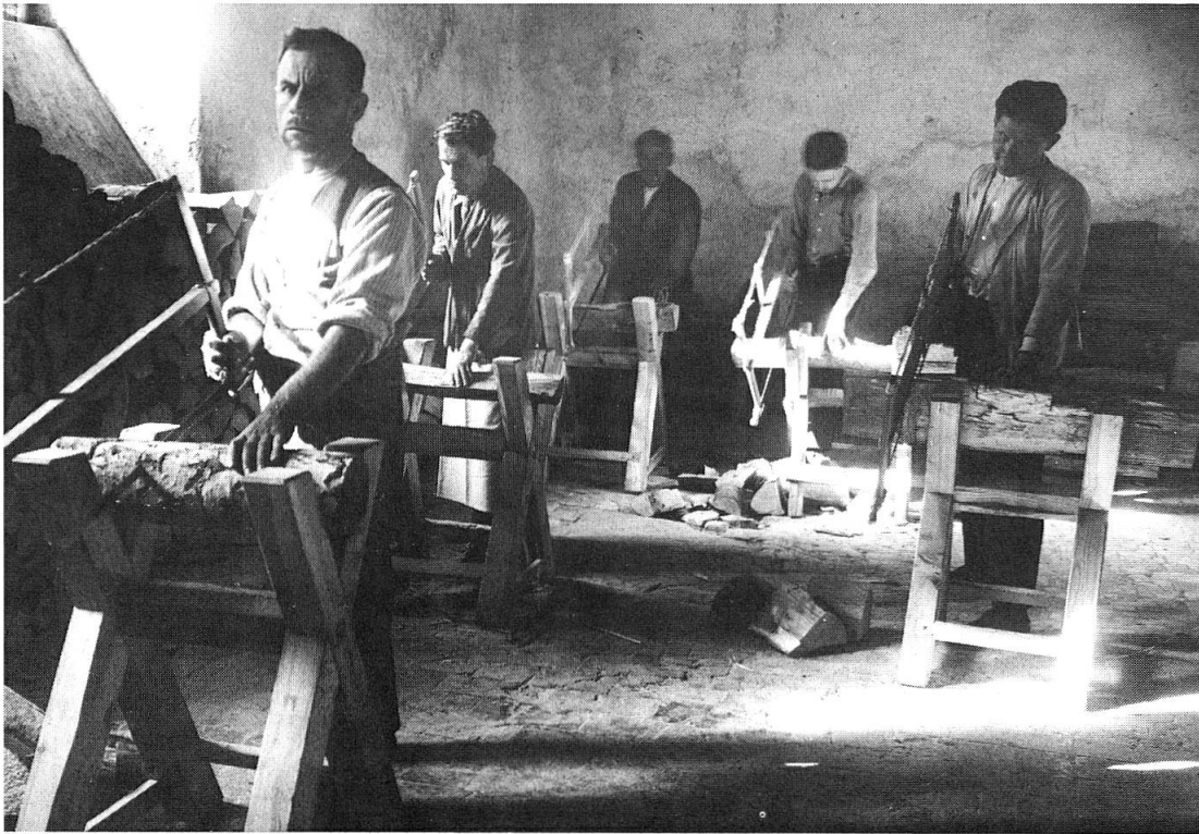
Abb.5: Arbeitstherapie für männliche Patienten, 1950er Jahre.

miteinander Heu einbrachten und Gemüse ernteten – wie grausam, wenn man sich dieselben Patienten tobend im Deckelbad vorstellt! Die Photographien aus über 100 Jahren zeigen, wie das Burghölzli langsam von der Stadt eingeholt und umschlossen worden ist – der lang hospitalisierte Patient vom Land, der auf dem Feld und im Stall zu brauchen war, ist verschwunden. Das Burghölzli hospitalisiert unter dem Druck der Aufnahmemöglichkeiten möglichst kurz; die Patienten sind Bewohner der Großstadt und ihrer Vorstädte; nur noch Schwerkranke oder allen Beziehungen Entfremdete treten ein, und sie werden so rasch wie möglich wieder entlassen. Das Asyl hat sich zum Kriseninterventionszentrum gewandelt.