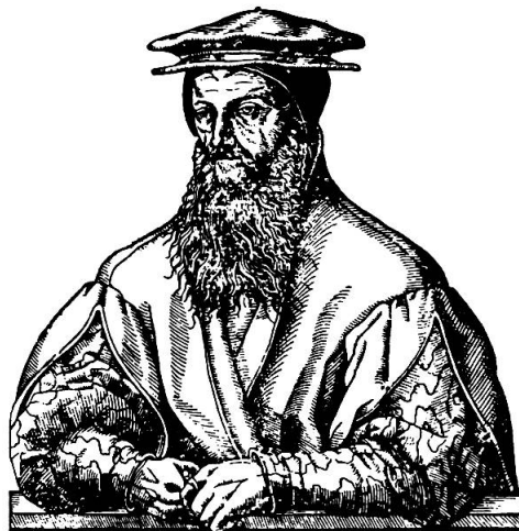
Konrad Gesner Arzt und Naturforscher in Zürich 1516–1565