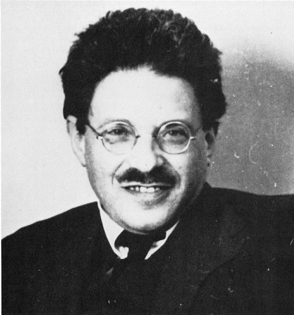
Abb.4. Paul Ehrenfest, kurz vor seinem Tode im September 1933 aufgenommen

Weißkopf an der Spitze einen entscheidenden Auftrieb. Schon bald sind die Erfolge auf diesem Sektor so groß, daß Heisenberg mit Anerkennung feststellen mußte: «Bei der Kernphysik in Amerika können wir hier gewissermaßen nur mit Bewunderung und ein wenig Neid zusehen.» Ein zweiter Aderlaß für die Wissenschaft folgte 1938 auf die Okkupation von Österreich durch die deutschen Truppen und die sog. «Reichskristallnacht» in Deutschland. Auch diesmal ließen sich rasch Interessenten im Ausland für die