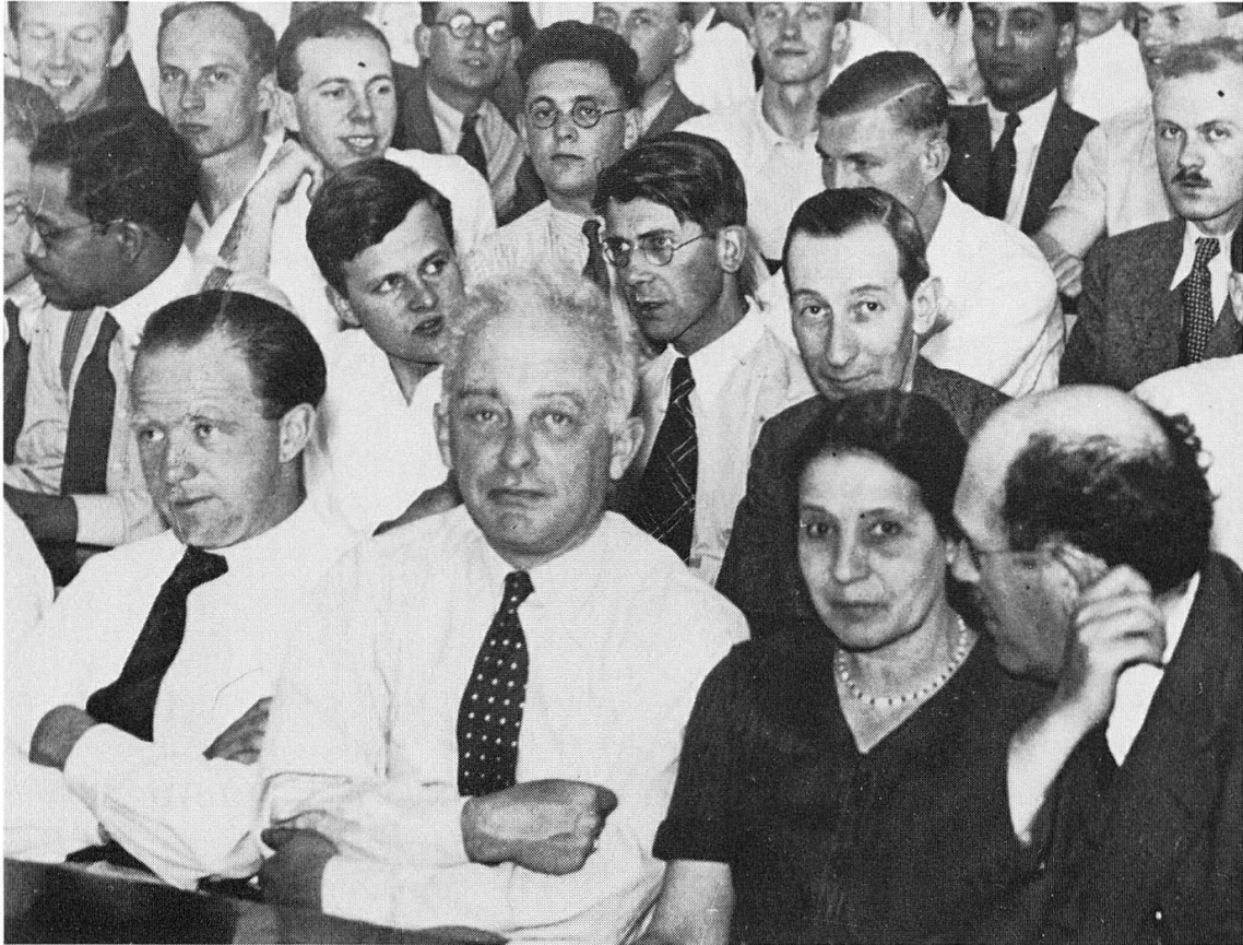
Abb.2. Physikertreffen in Kopenhagen. In der ersten Reihe (von links nach rechts): Heisenberg, ?, Meitner und Stern. Zweite Reihe: ?, v. Weizsäcker, Hund, ?. Rechts hinten Dirac

genannten Ehrenfest-Schüler Goudsmit und Uhlenbeck aufrecht. Diesem Zwecke dienten auch längere Europareisen amerikanischer Gelehrter und Forscher wie Millikan, Randall und des sich inzwischen in Amerika heimisch fühlenden Goudsmit.