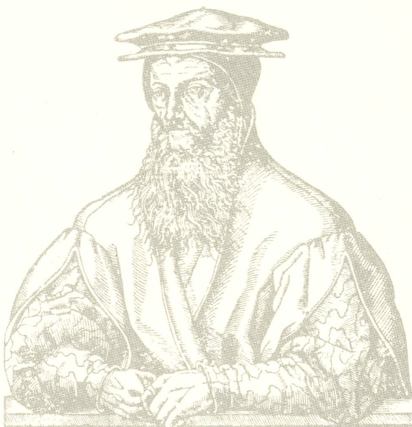
Conrad Gessner 1516–1565

Swiss Journal of the History of Medicine and Sciences Vol. 59 (2002) N° 3/4