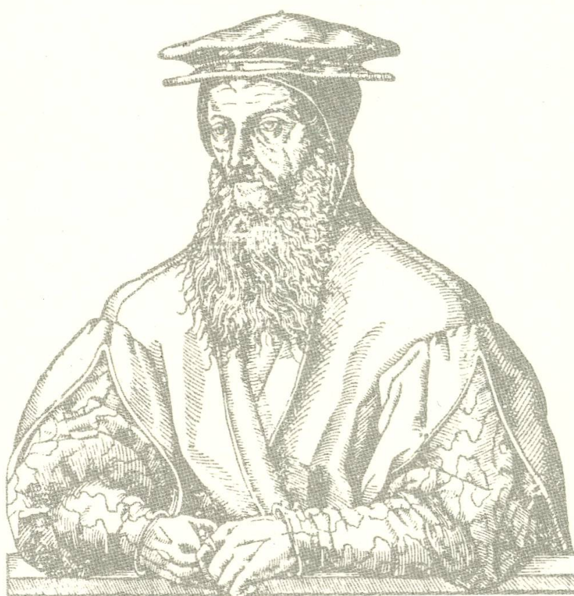
Conrad Gessner 1516–1565

Swiss Journal of the History of Medicine and Sciences Vol. 59 (2002) N° 1/2