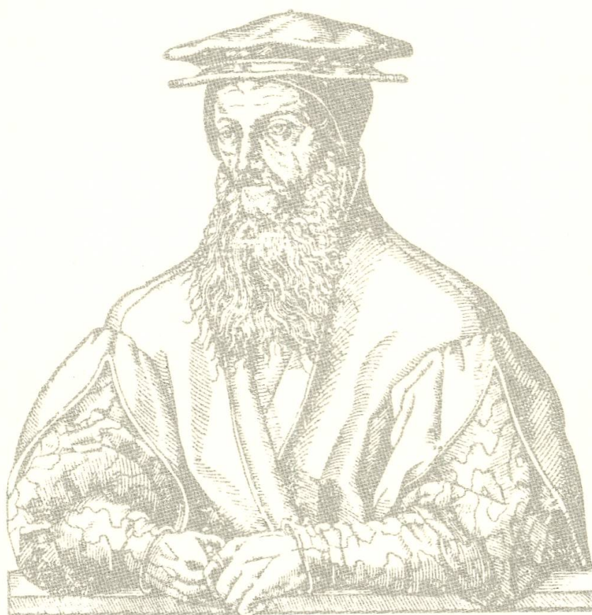
Conrad Gessner 1516–1565

Swiss Journal of the History of Medicine and Sciences Vol. 58 (2001) N° 1/2