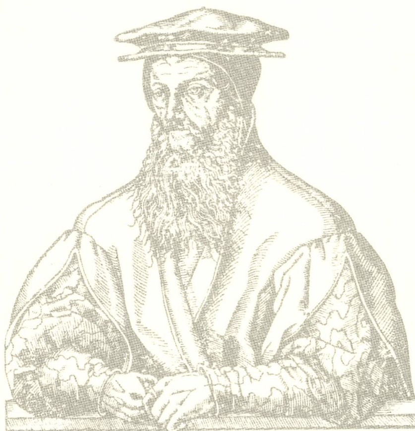
Conrad Gessner 1516–1565

Swiss Journal of the History of Medicine and Sciences Vol. 58 (2001) N° 1/2