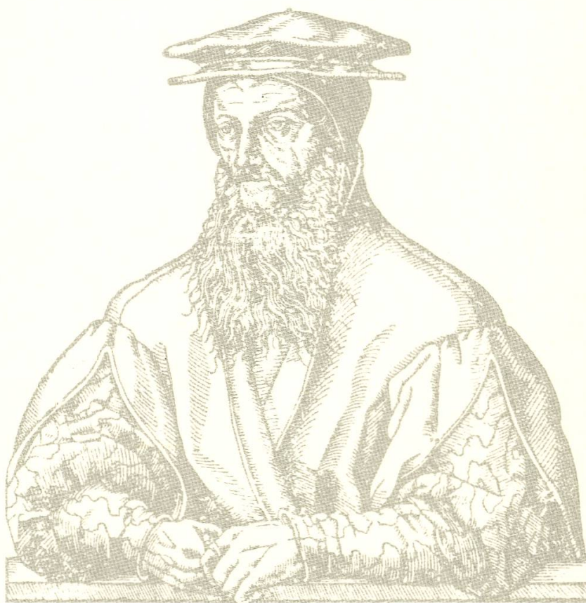
Conrad Gessner 1516–1565

Swiss Journal of the History of Medicine and Sciences Vol. 58 (2001) N° 3/4