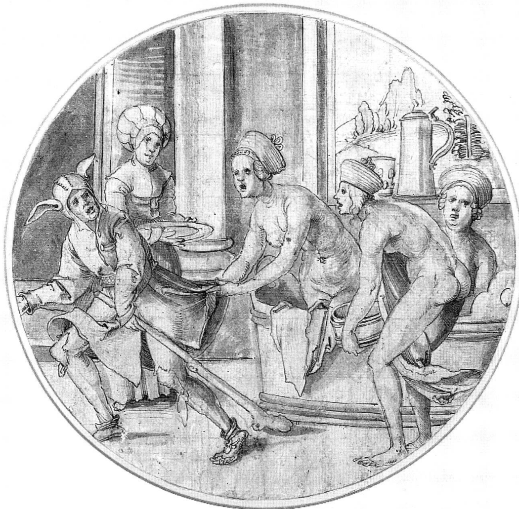
Abb. 1. Gelegentliche Exzesse brachten die Badestuben in Verruf und bestärkten die Vorurteile gegen die Bader und ihre Bediensteten. Hans von Kulmbach: Frauenbad mit Narren, 1511–1517 (Städelsches Kunstinstitut in Frankfurt am Main).