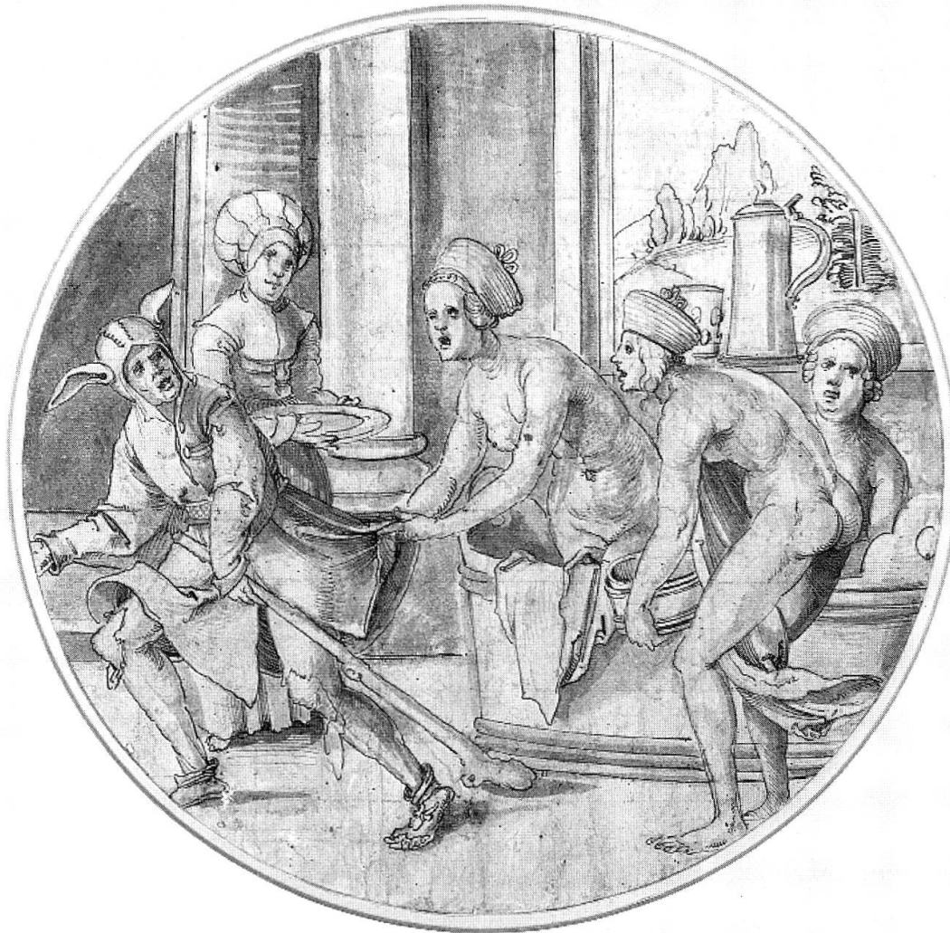
Abb. 1. Gelegentliche Exzesse brachten die Badestuben in Verruf und bestärkten die Vorurteile gegen die Bader und ihre Bediensteten. Hans von Kulmbach: Frauenbad mit Narren, 1511–1517 (Städelsches Kunstinstitut in Frankfurt am Main).