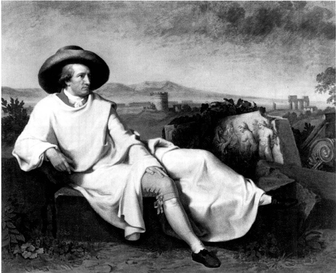
Abb. 1. J.H.W. Tischbein «Goethe in der Campagna di Roma», Städelsches Kunstinstitut Frankfurt am Main.

Diese lapidare Aussage gab den Anlass zu weiteren Nachforschungen über Aussehen, Entstehung und Verbleib dieser Zeichnung. Im Archiv der Familie Lavater in Zürich fanden sich noch weitere Briefe mit Vertretern des Weimarer Hofes, die über diese pharmazie- und kunsthistorisch interessante Begebenheit Aufschluss gaben 2 . Die Zeichnung, welche heute im Goethe-Nationalmuseum in Weimar verwahrt wird, ähnelt dem Ölgemälde «Goethe in der Campagna di Roma» von Johann Heinrich Wilhelm Tischbein (1751–1829) – dem Sinnbild für Goethes italienische Reise, das sich heute im Städelschen Kunstinstitut Frankfurt befindet (Abb. 1) 3 . Wie das Bild in den Besitz der Familie Lavater gelangte und welche Beziehungen zu Johann Wolfgang von Goethe (1749–1832), aber auch zu Tischbein bestanden, soll nachfolgend näher beleuchtet werden.