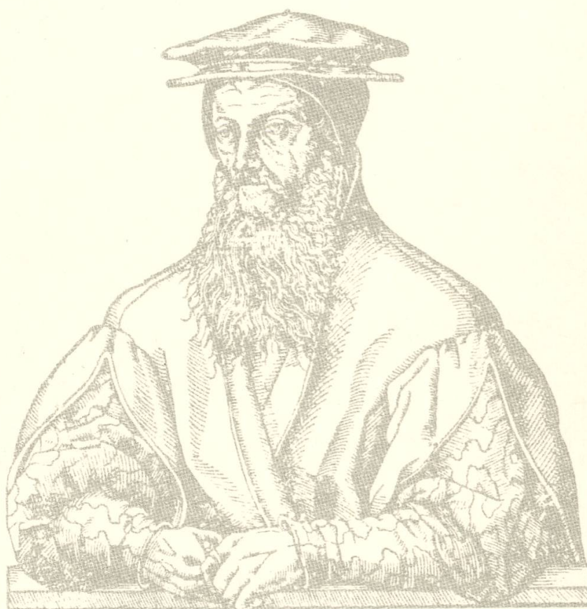
Conrad Gessner 1516–1565

Swiss Journal of the History of Medicine and Sciences Vol. 54 (1997) N° 1/2