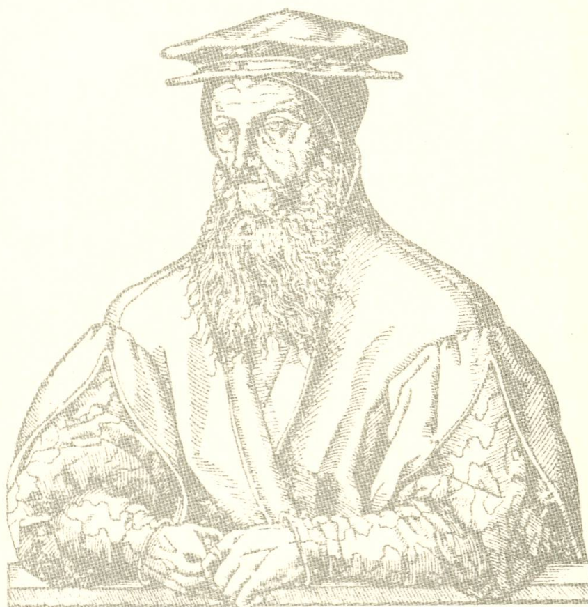
Conrad Gessner 1516–1565

Swiss Journal of the History of Medicine and Sciences Vol. 52 (1995) N° 3/4