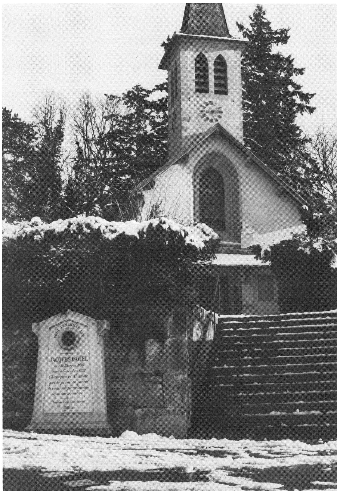
Fig. 4. Monument érigé par les ophtalmologues suisses (1885)