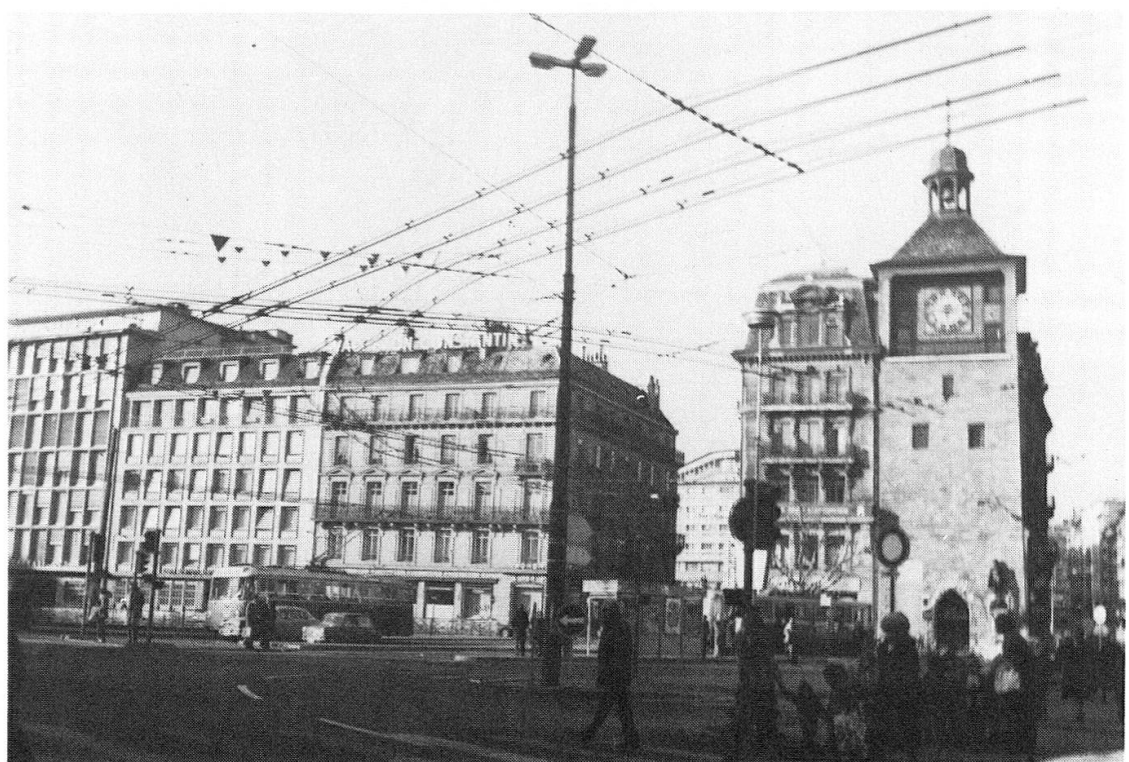
Fig. 3. Vues de la Place Bel-Air, a) par Geissler au XVIII e , b) en 1976