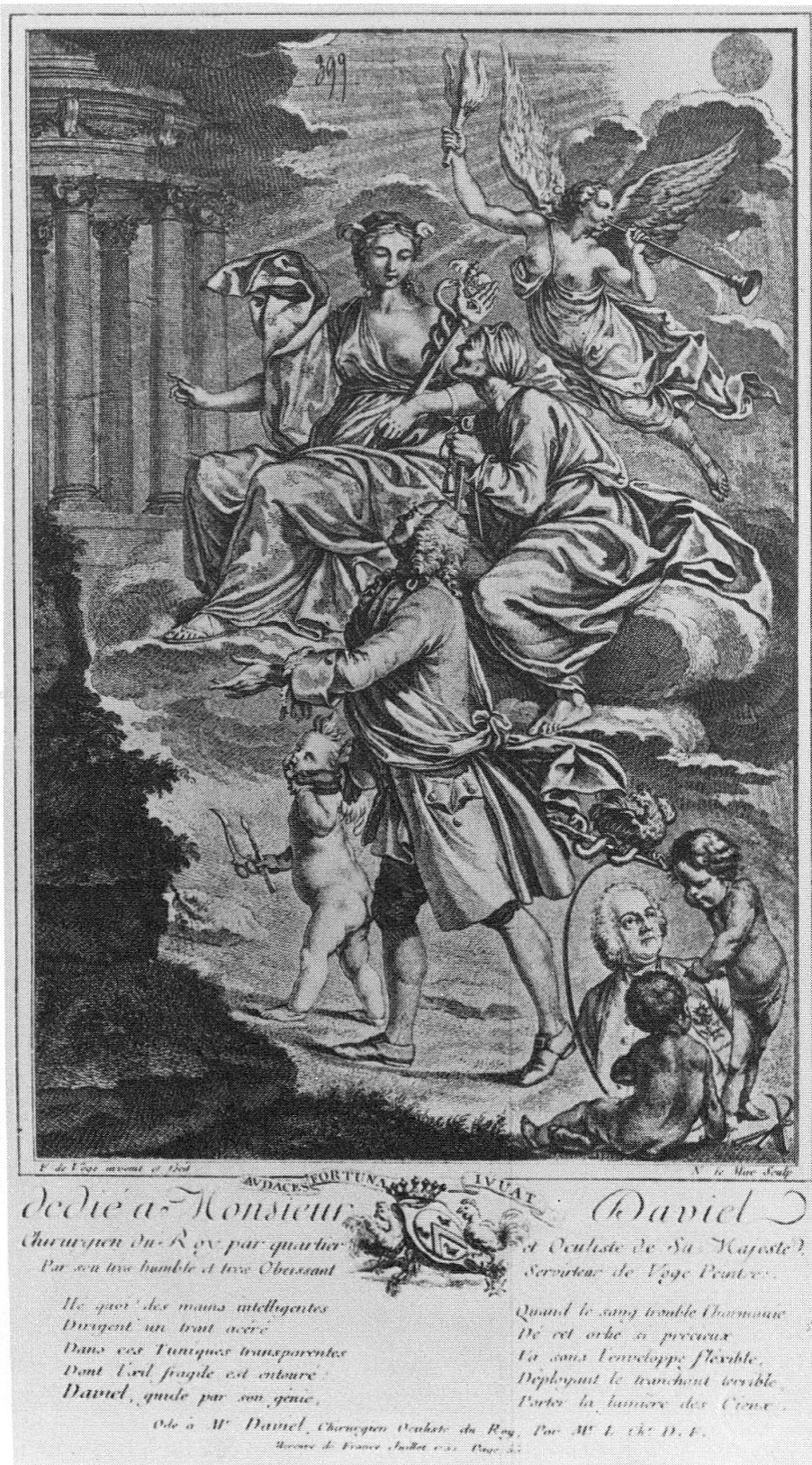
Fig. 2. Allégorie et ode parues au Mercure de France (1752)