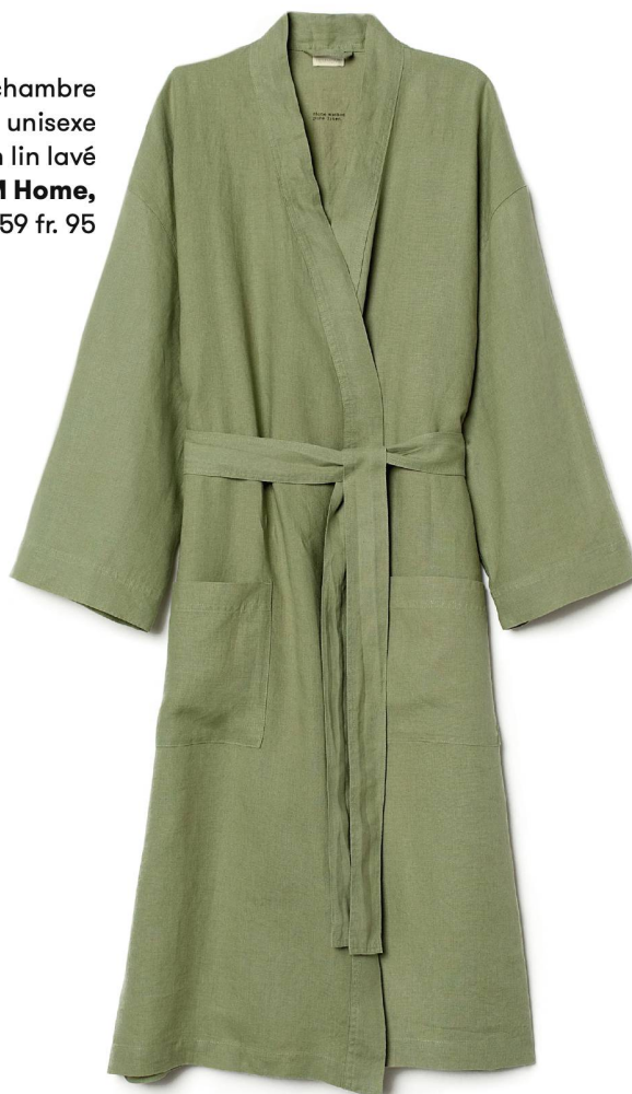
Robe de chambre unisexe en lin lavé H&M Home, 59 fr. 95