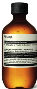
Gel nettoyant pour le corps Aēsop, 25 fr. les 200 ml.