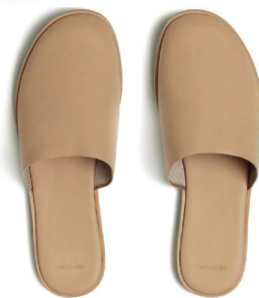
Chaussons en cuir H&M Home, 59 fr. 95