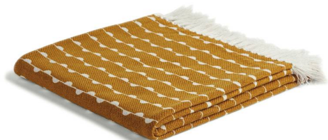
Plaid imprimé La Redoute Interieurs, 49 fr. 95