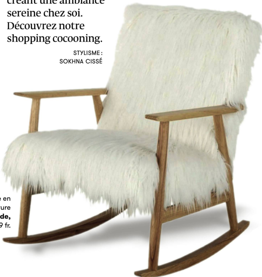
Fauteuil à bascule en fausse fourrure Maisons du Monde, 399 fr.