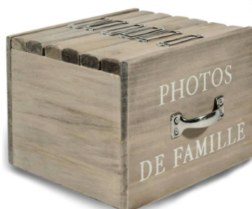
Boîte pour photos Maisons du Monde, 18 fr. 95