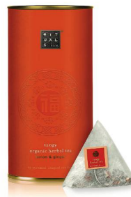
Infusion bio «The Ritual of happy Buddha» Rituals, 7 fr. 50 les 65 g.