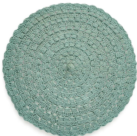
Tapis en crochet La Redoute Interieurs, 64 fr. 95