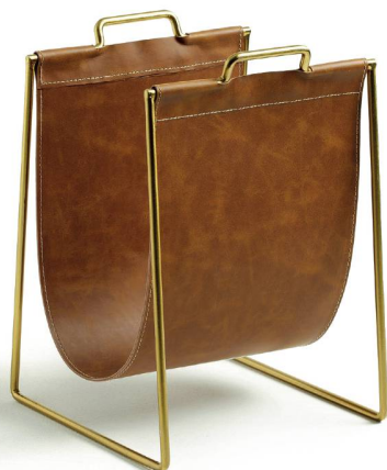
Porte-revues La Redoute Intérieurs, 74 fr. 95