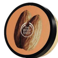
Beurre corporel à l'amande The Body Shop, 24 fr. 95 le 200 ml.