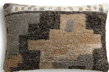
Coussin rembourré Zara, 69 fr. 90