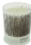
Bougie parfumée au cèdre Esteban chez Nature & Découvertes, 24 fr. 95