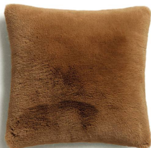
Housse de coussin en fausse fourrure Zara, 59 fr. 90