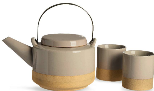
Service à thé en porcelaine Depot, 29 fr. 95