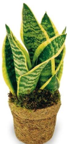
Plante d'intérieur «Sansevieria» Hornbach, 16 fr. 90