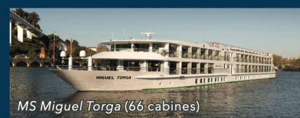
MS Miguel Torga (66 cabines)

Le pré et post acheminement de votre résidence à Genève | Les excursions | Les dépenses personnelles à bord et/ou pendant les excursions | Les assurances annulation/ bagages/ rapatriement.