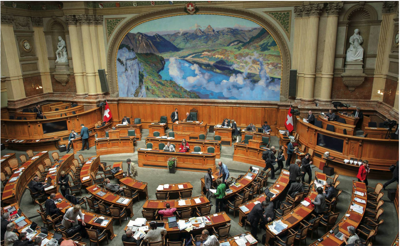
Au Parlement, la cause des seniors fait souvent l'objet d'une séparation nette entre gauche et droite.

peu du centre. Ce n'est pas une surprise! La gauche ne se soucie guère de trouver le financement nécessaire à ses largesses. Il n'y a que deux solutions pour dépenser plus: on peut laisser filer la dette, et c'est un cadeau empoisonné qu'on laisse à la génération montante, ou on peut augmenter taxes, impôts et redevances, ce qui