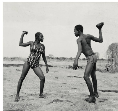
François Riou, photovot, Valérie Pinauda, Eddie Taz, Christoph Gerjig et DR

Sous l'œil de Malik Sidibé, Musée Barbier-Mueller, Genève, jusqu'au 12 janvier